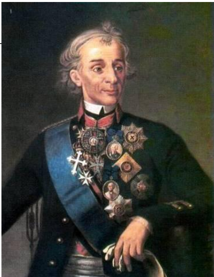
Александр Суворов - великий русский полководец.