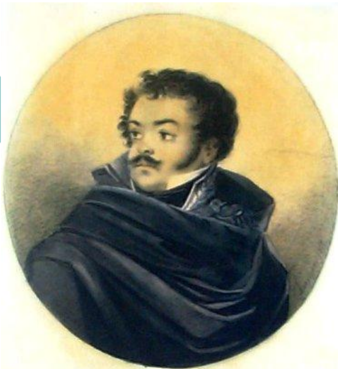
Денис Давыдов - кавалергард