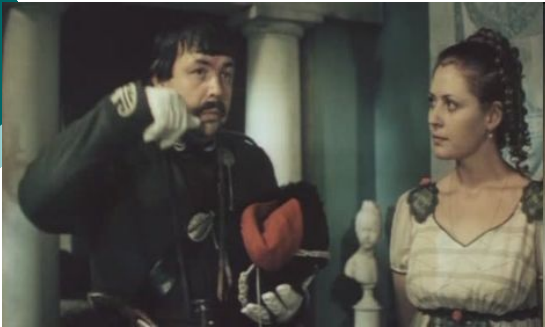
Кадры из фильма «Эскадрон гусар летучих»