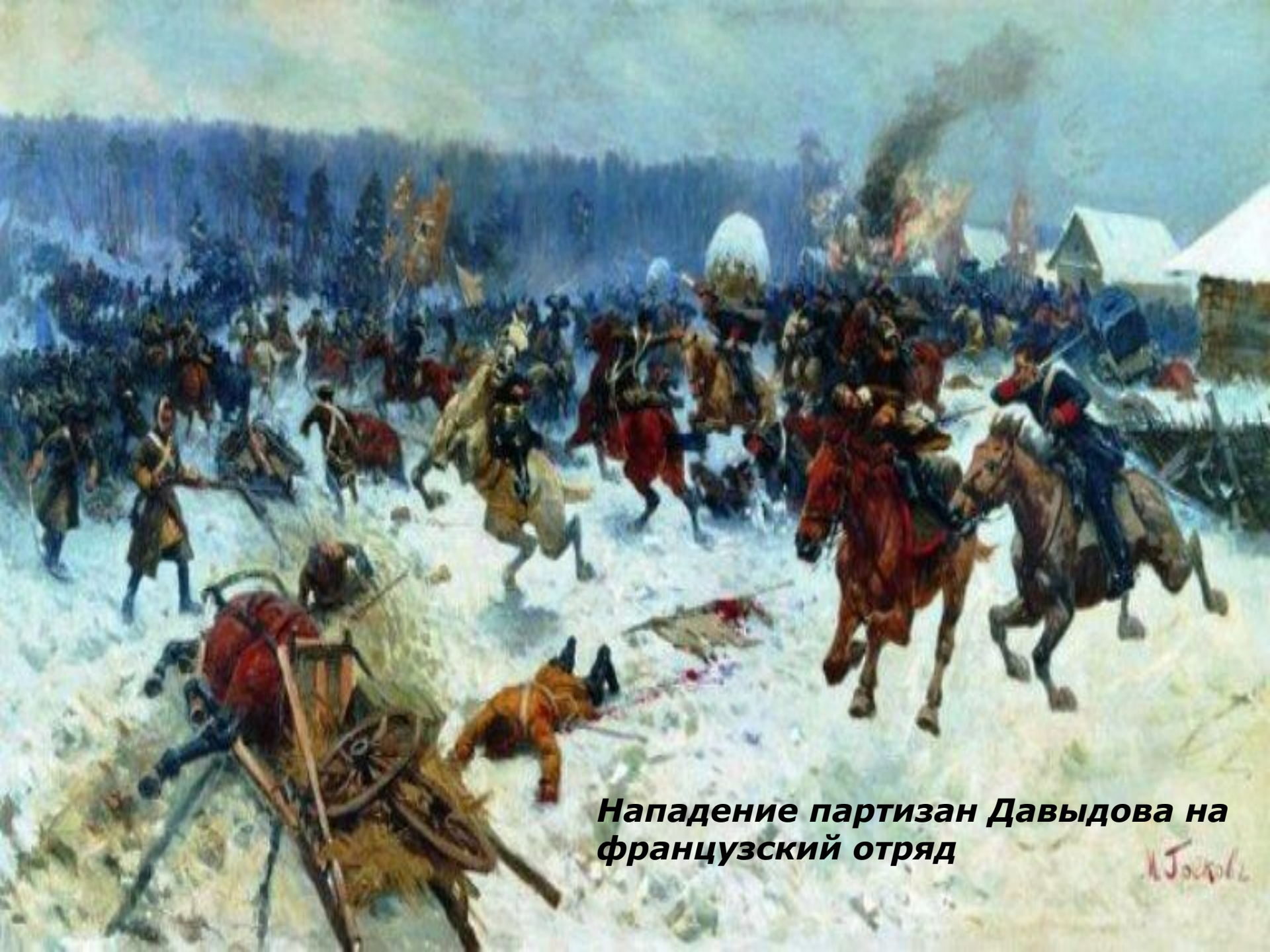
Нападение партизан Давыдова на французский отряд