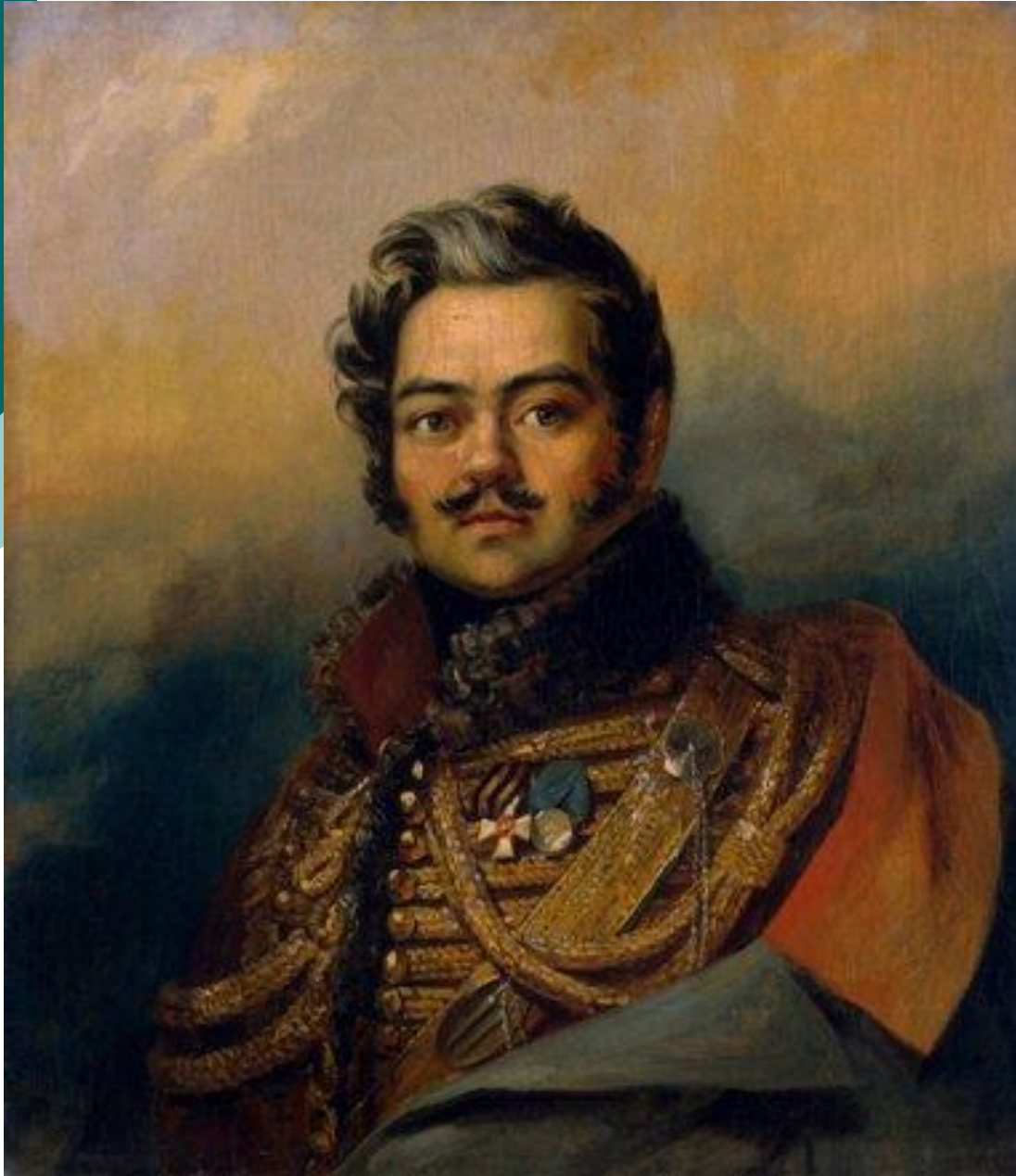
Денис Васильевич Давыдов (1784 – 1839)