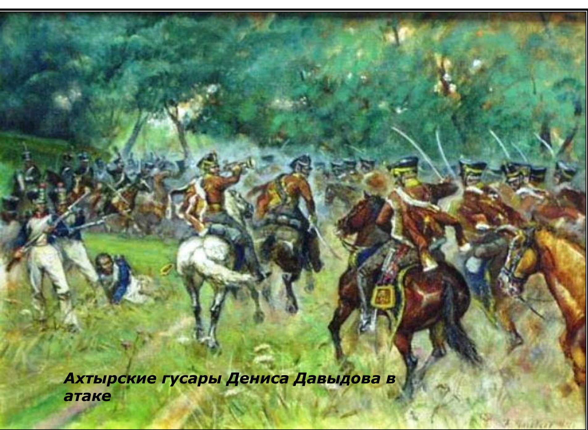
Ахтырские гусары Дениса Давыдова в атаке