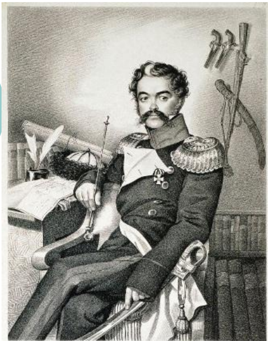
Д. В. ДАВЫДОВЪ.