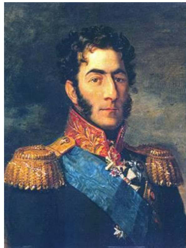
Багратион Пётр Иванович