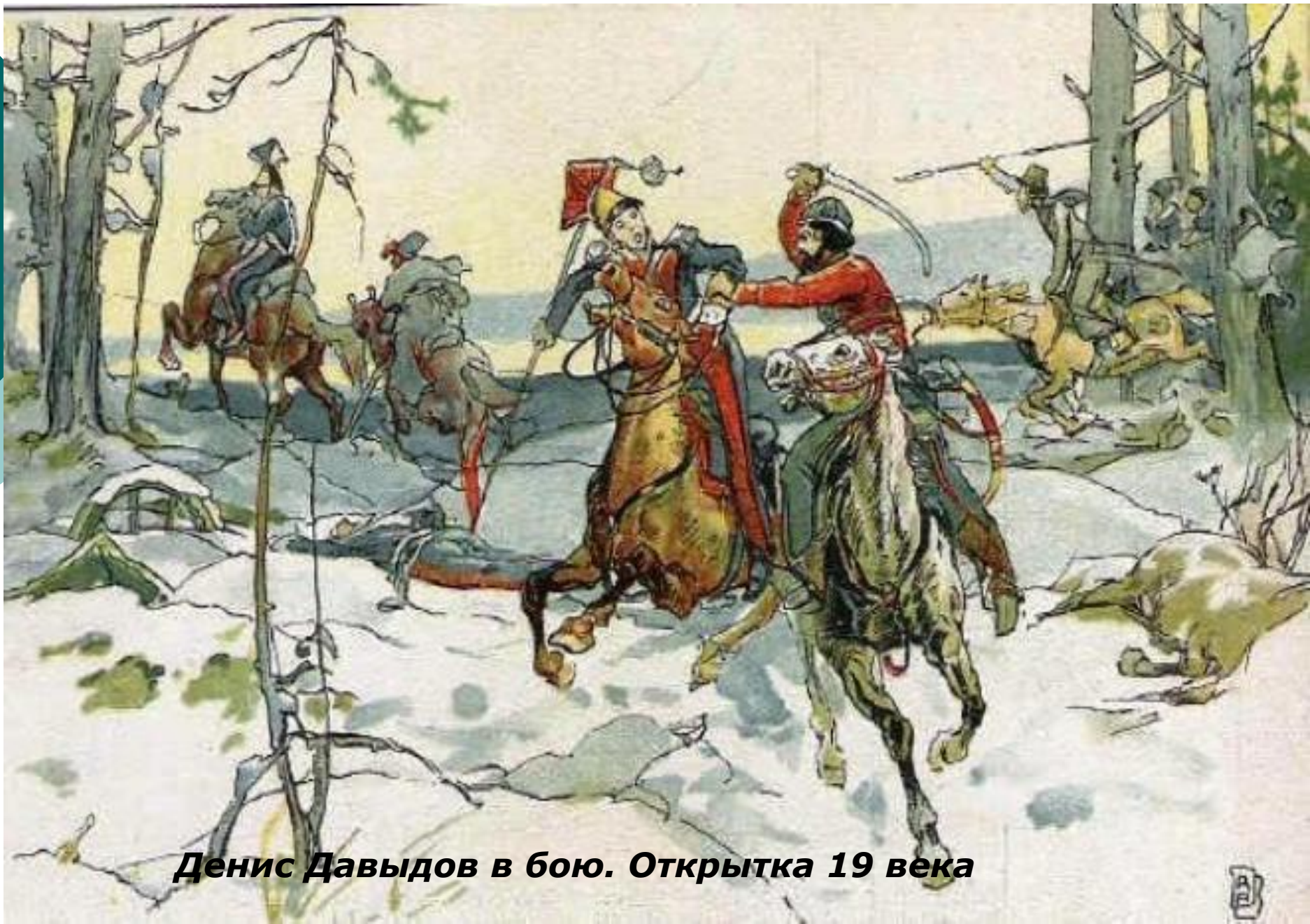
Денис Давыдов в бою. Открытка 19 века