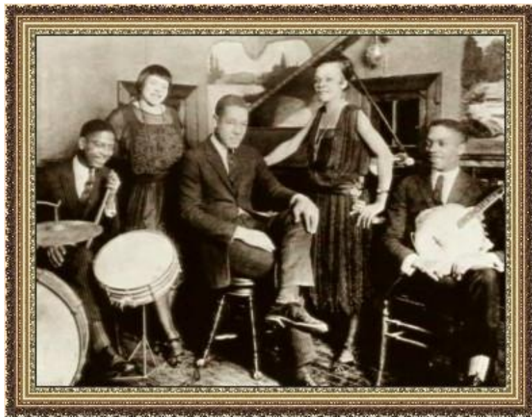
Негритянский джазовый оркестр

1927 – первый звуковой фильм. Документальный фильм. «Золотой век Голливуда» – производство на поток.