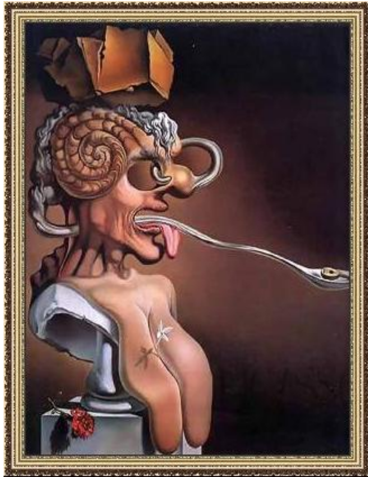
С. Дали. Портрет П. Пикассо

Б.Брехт – «Трехгрошовая опера». Надежда на новые социальные идеи.