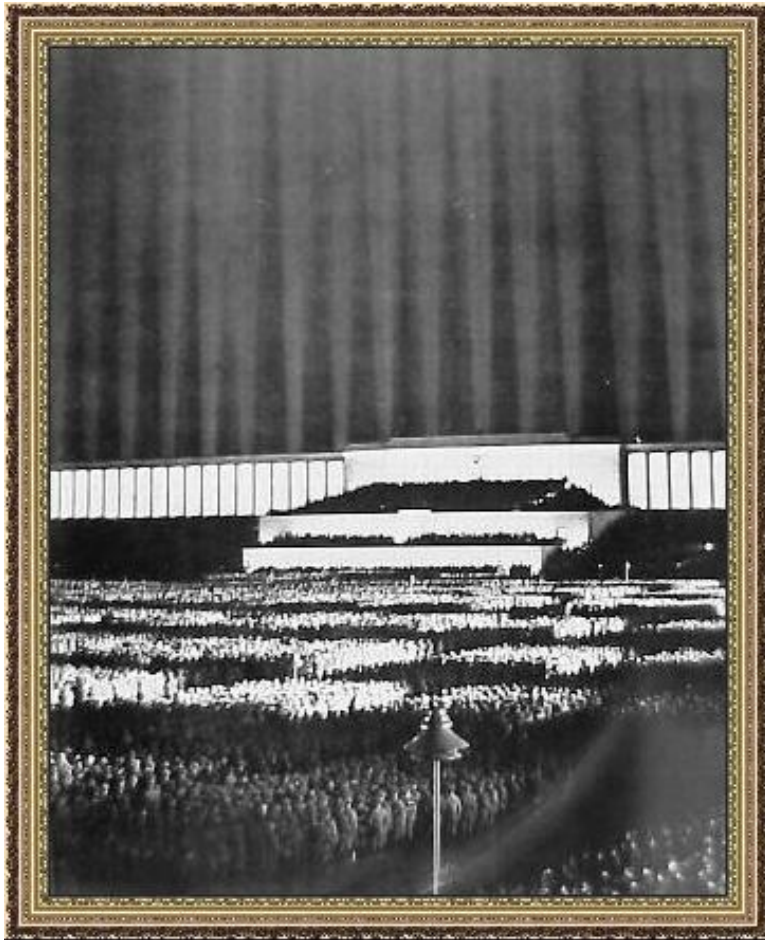
Нюрнберг. Партийный форум

1925 – Муссолини – фашизация нации, культура – инструмент. Контроль государства.