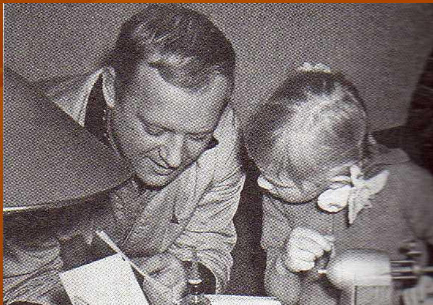
Юрий Визбор с дочерью