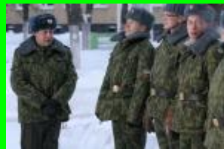
Построение – заработок нарядов