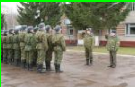
Плац – долина смерти