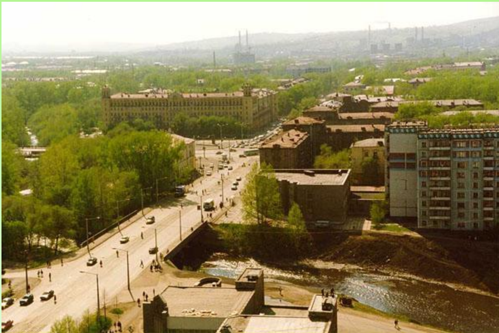
Улица Орджоникидзе и НКМК (вдали)