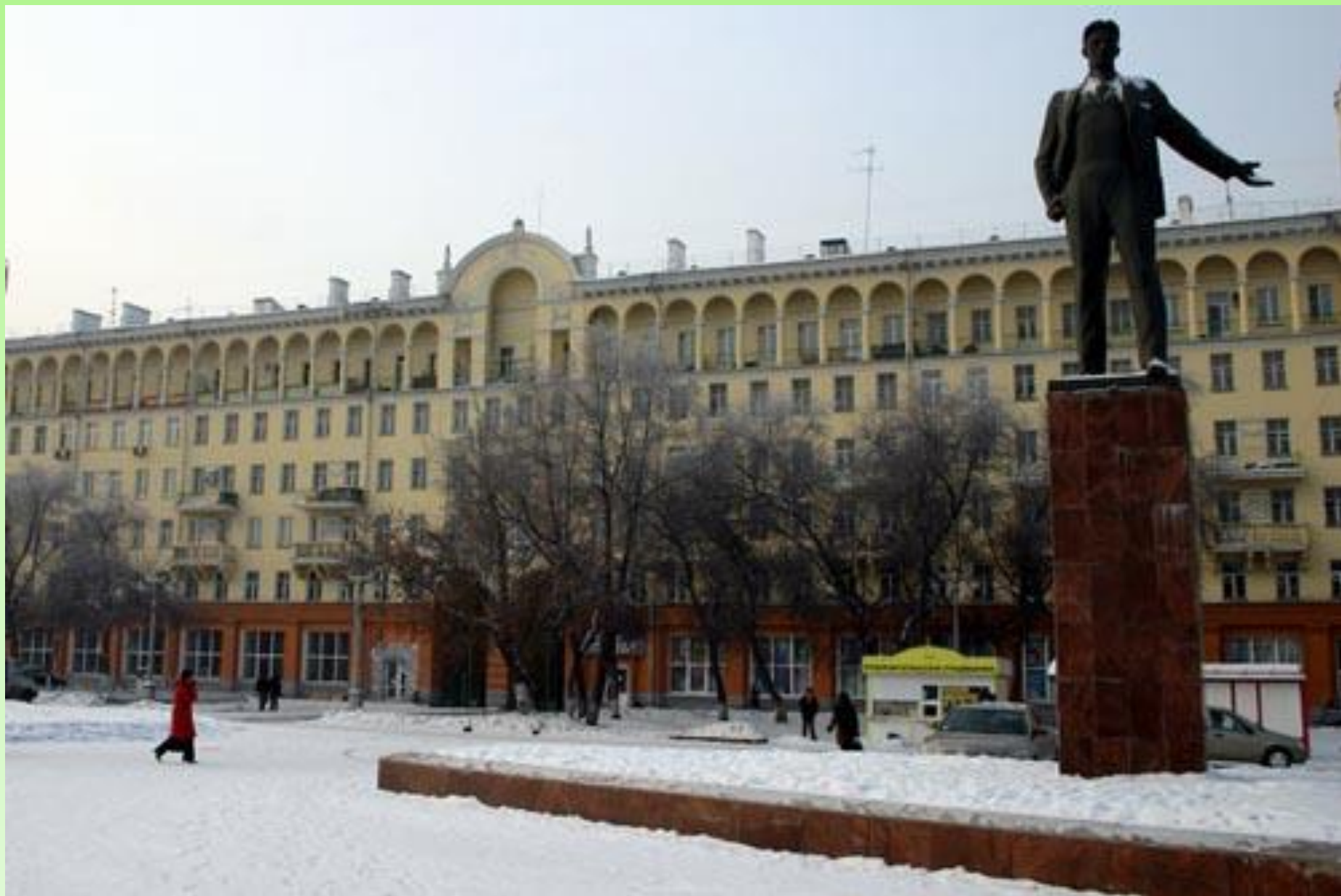
250- квартирный дом