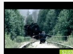
В июне 1941-го: Серия 1 Экшен