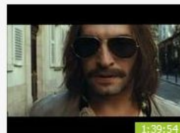
99 франков Смешное