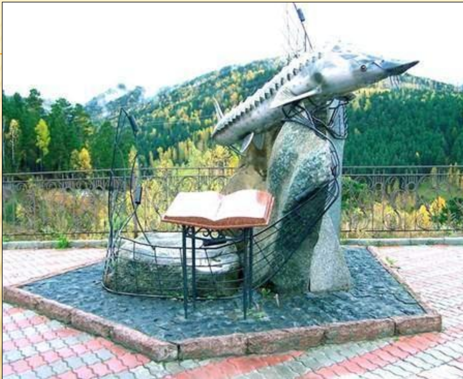
Красноярск. Памятник повести В. Астафьева «Царь-рыба».