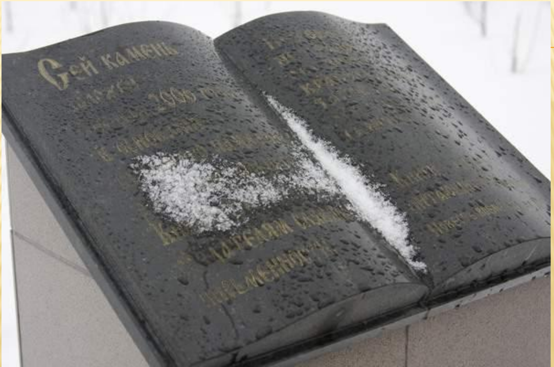
Россия. Сургут. Памятник книге.