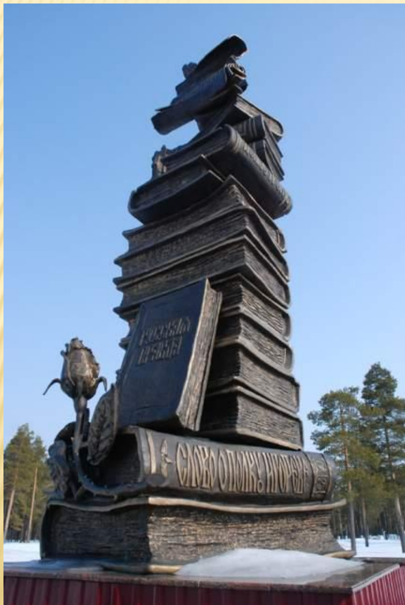
Памятник работы З. Церетели