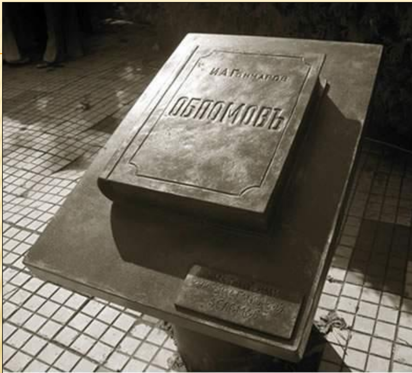
Россия. Симбирск. Памятник роману Гончарова “Обломов”.