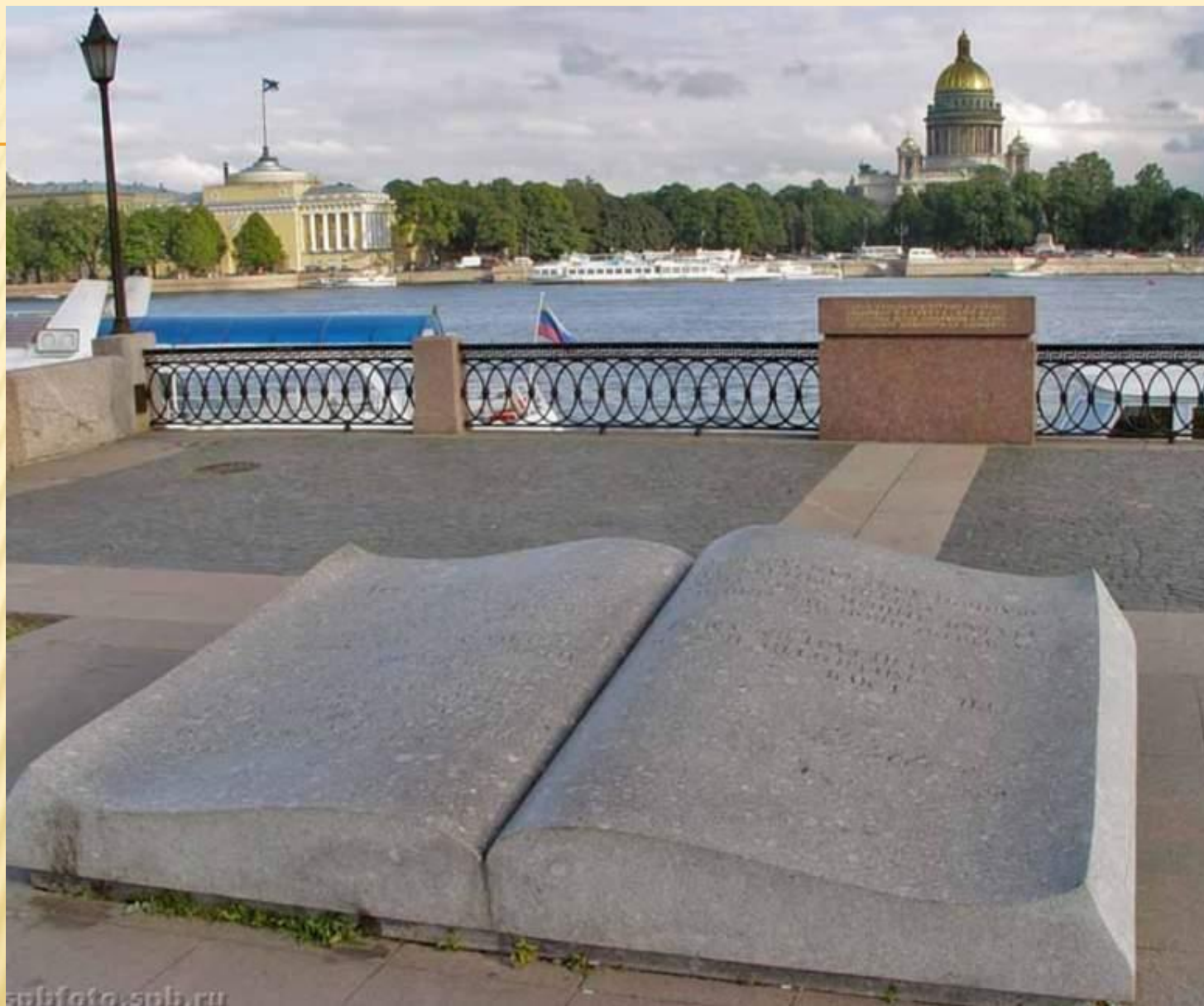
Россия. Санкт-Петербург. Книга на Университетской набережной. На книге высечены строки Пушкина “Люблю тебя, Петра творенье...”