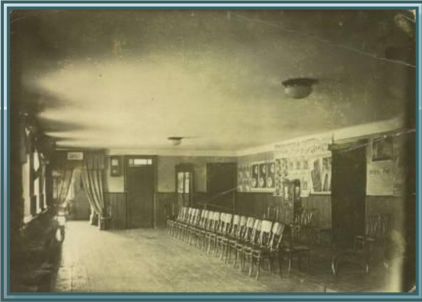
Фойе первого этажа. 1950 г. Р-776, оп. 2, д. 1