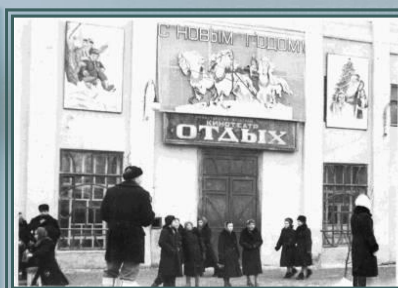
Кинотеатр в 1960-е годы. Р-750, оп.1-ф, д. 12024, 12051, 12050, 12049