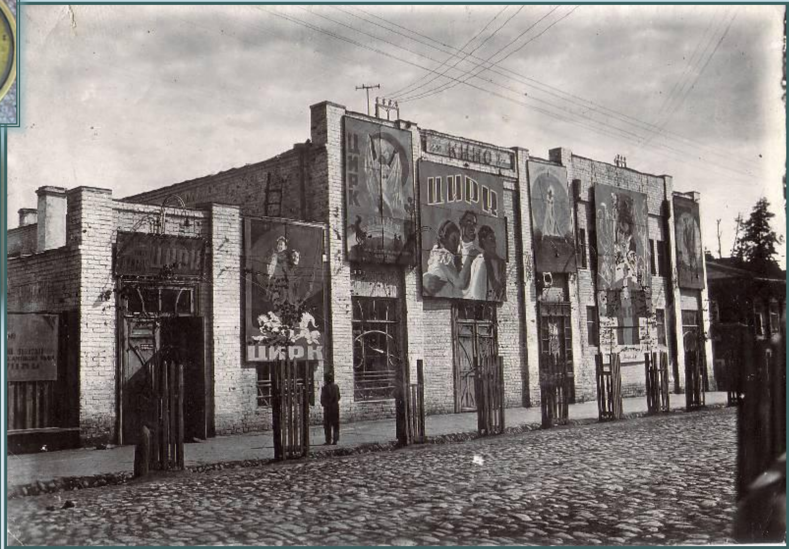
Так выглядел кинотеатр в довоенные годы. [1936] г. Р-750, оп.1-ф, д. 11994