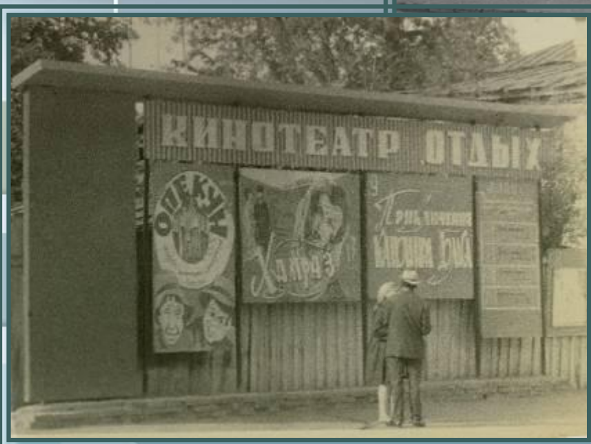
Р-776, оп. 2, д. 5

В семидесятых годах со здания кинотеатра убрали все афиши, переместив их на специально построенный для этого афишный ряд, который располагался напротив кинотеатра через дорогу.