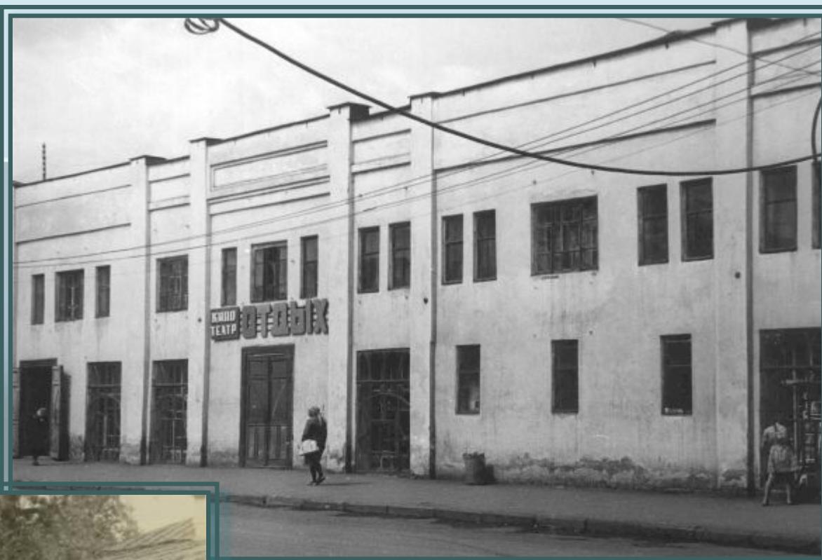
Р-750, оп. 1-ф, д. 263

В семидесятых годах со здания кинотеатра убрали все афиши, переместив их на специально построенный для этого афишный ряд, который располагался напротив кинотеатра через дорогу.