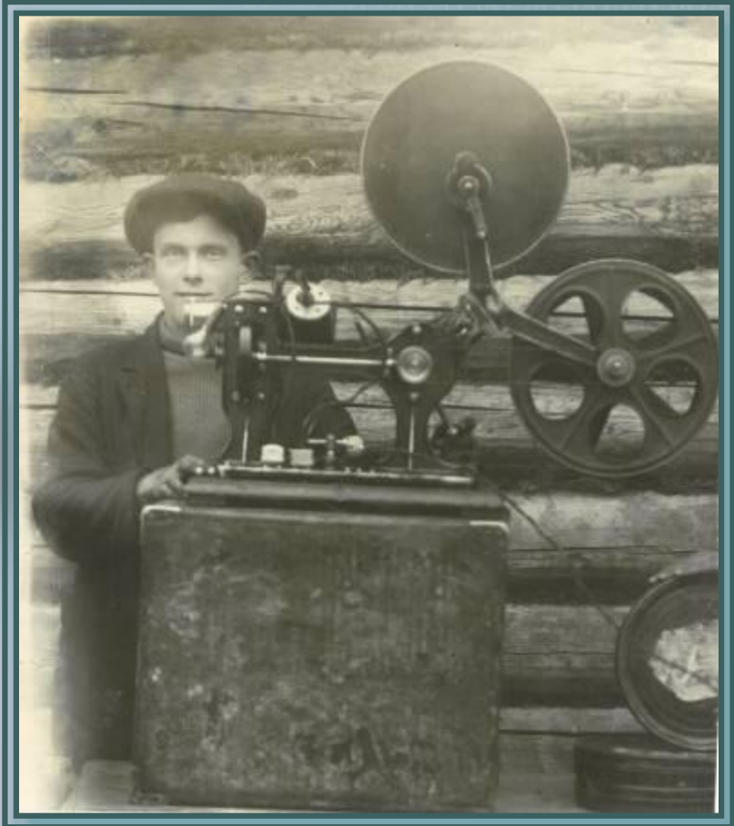
Р-750, оп. 1-ф, д. 3617