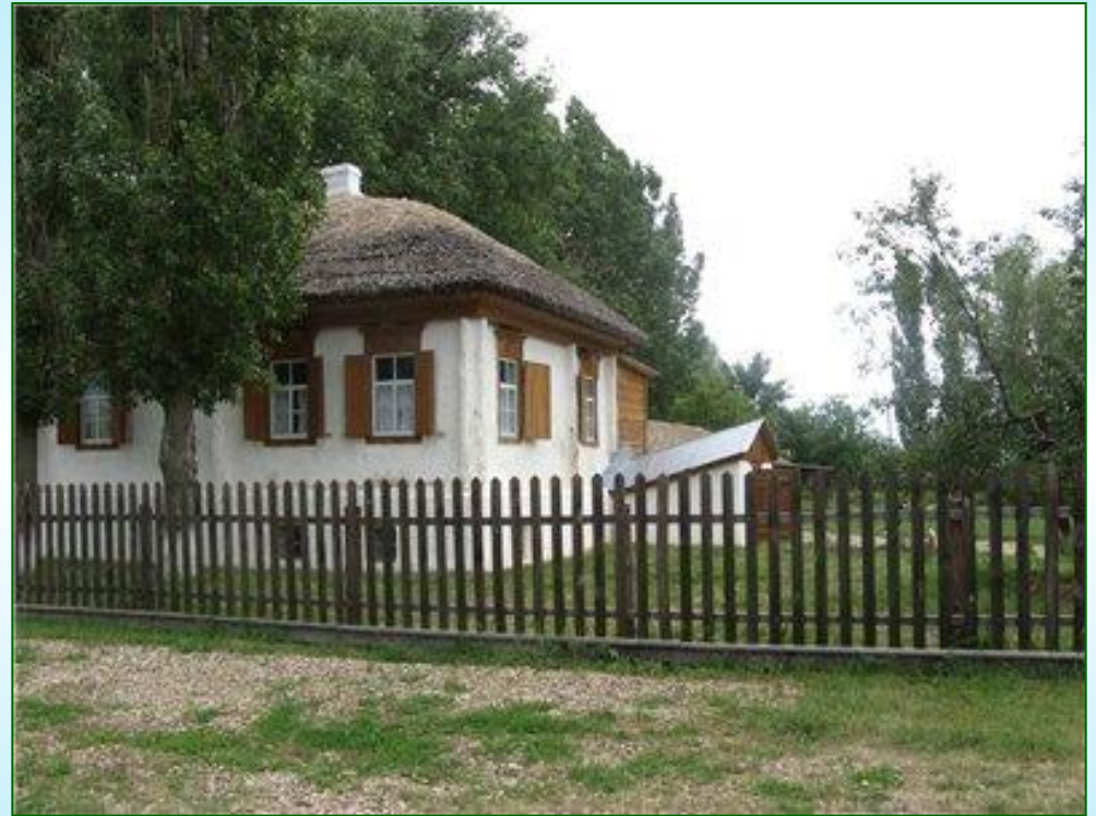
Хутор Кружилин, станица Вешенская

Среди шести материков В краю, где плещет Дон, Стоит на стыке двух веков Соломой крытый дом. Я низко кланяюсь ему, Не постучав в окно. Другие люди в том дому Живут давным-давно Но та же в окнах синева. И так же помнит дом того, Кто первые слова Здесь начинал с трудом.