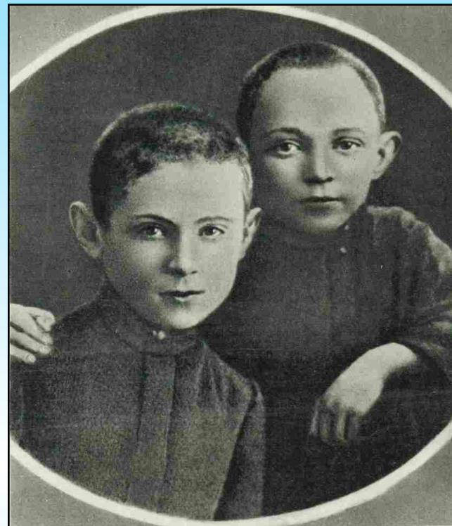
Михаил Шолохов (справа)- ученик 1-го класса мужской гимназии