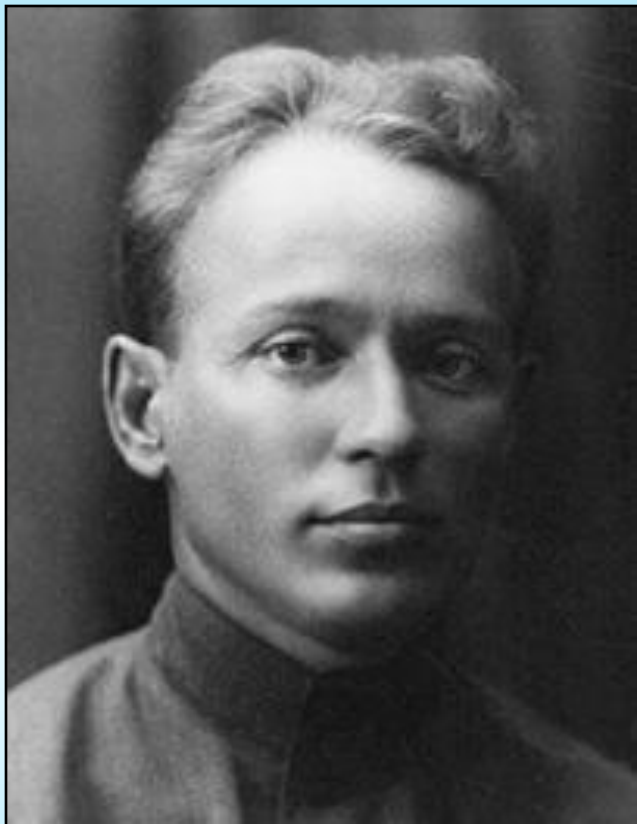
Михаил Шолохов в юношеские годы