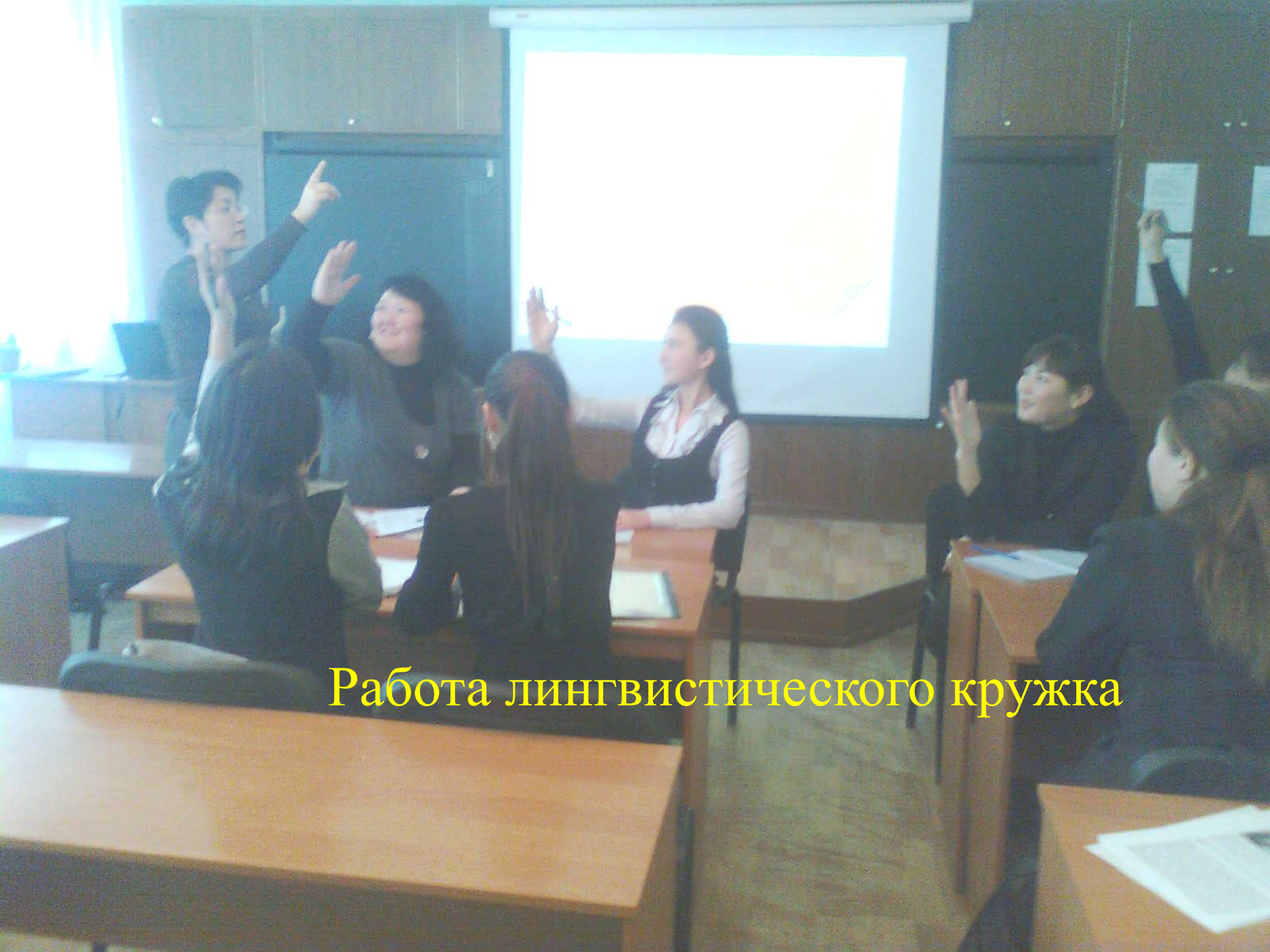
Работа лингвистического кружка