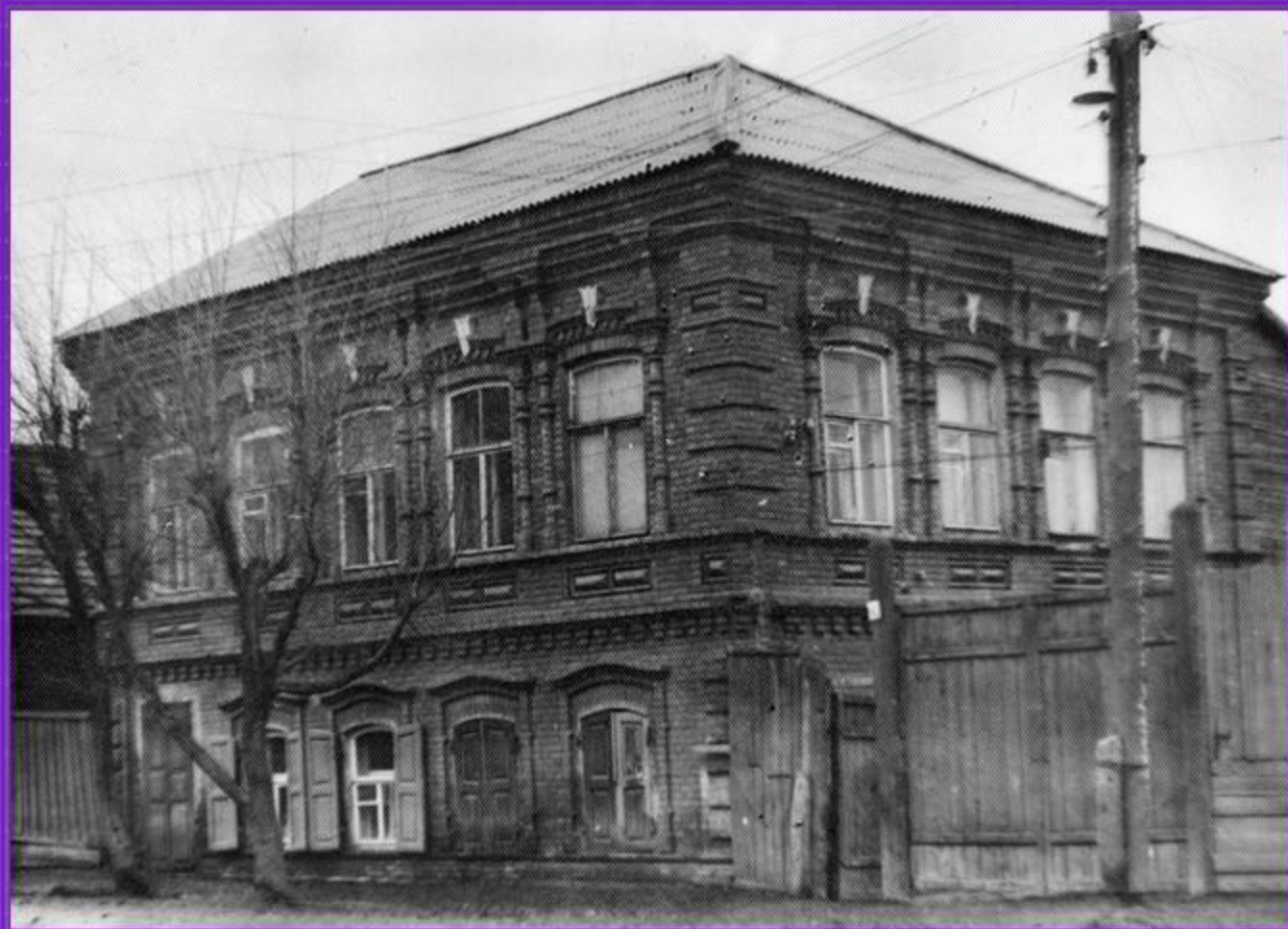
Улица Аткарская, дом 42. 1958 г.