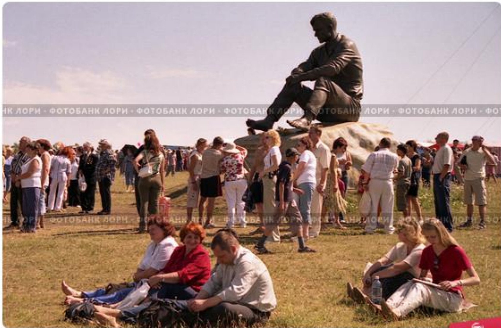
У памятника Василию Макаровичу Шукшину, гора Пикет