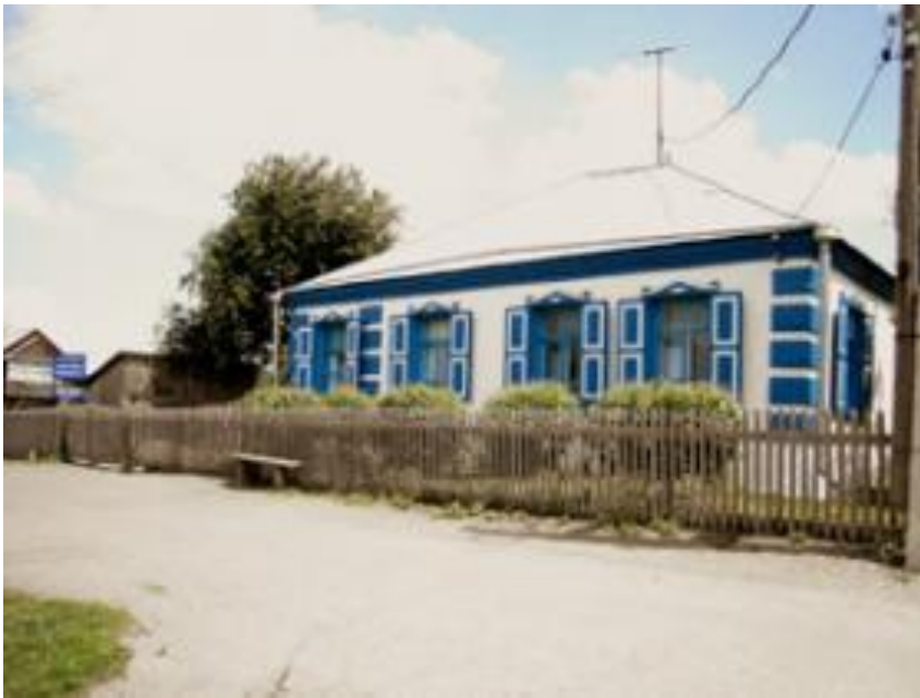
Дом матери Шукшина