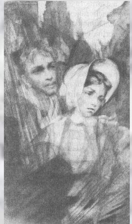
"Белые ночи". Настенька и мечтатель.

1846 - первая повесть, "Бедные люди". В других произведениях 40-х гг. - "Двойник" (1846), "Белые ночи" (1848), "Неточка Незванова" (1849) - возникает тема психологической двойственности человека, характерная и для позднего периода творчества.