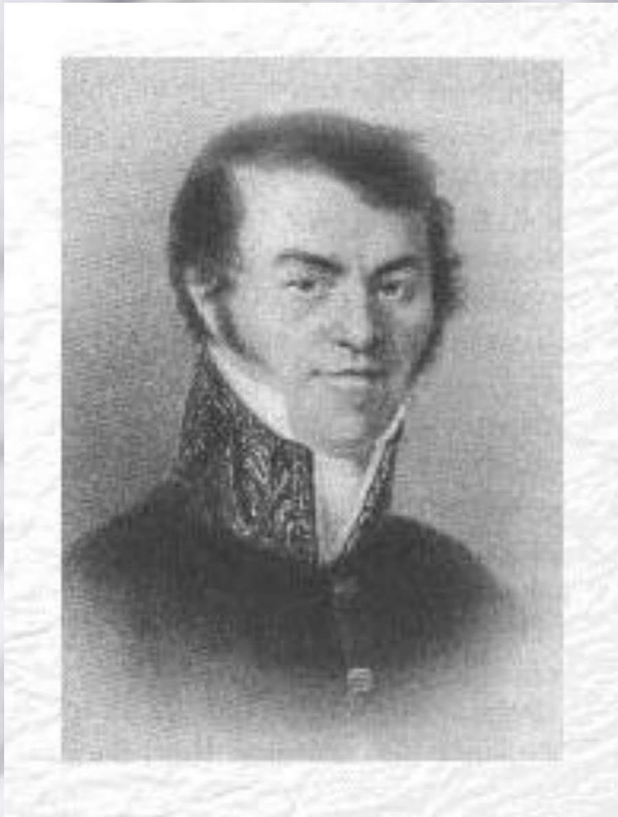
Отец писателя. М. Достоевский.