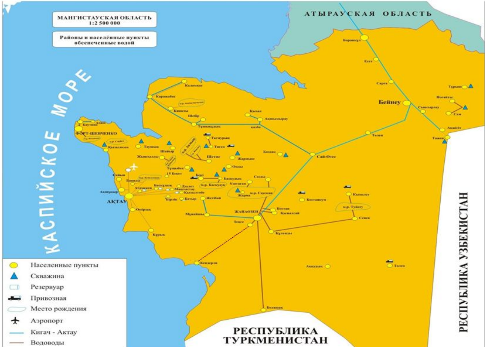
Схема водоснабжения области