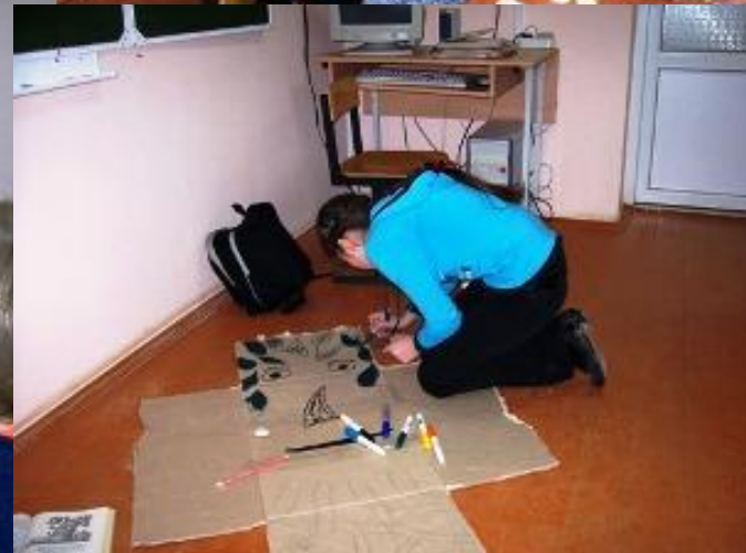
Подготовка к КВН