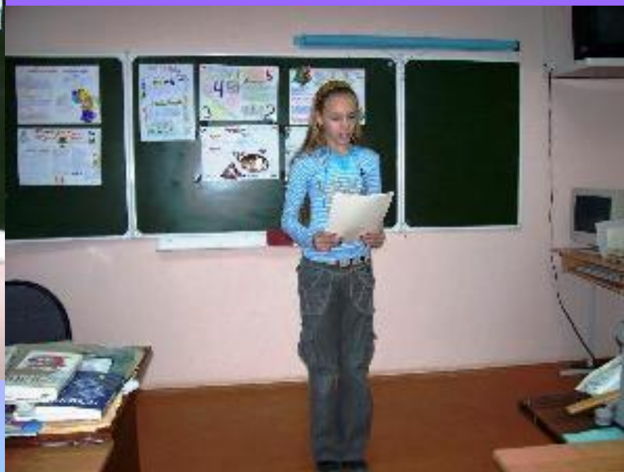
Доклад о Софье Ковалевской