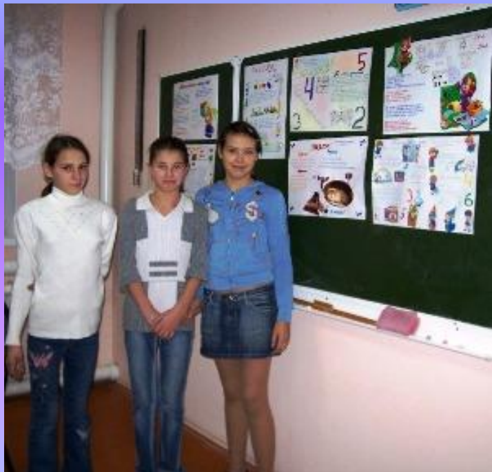
Редколлегия 6 класса