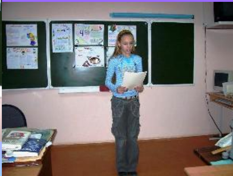
Доклад о Софье Ковалевской