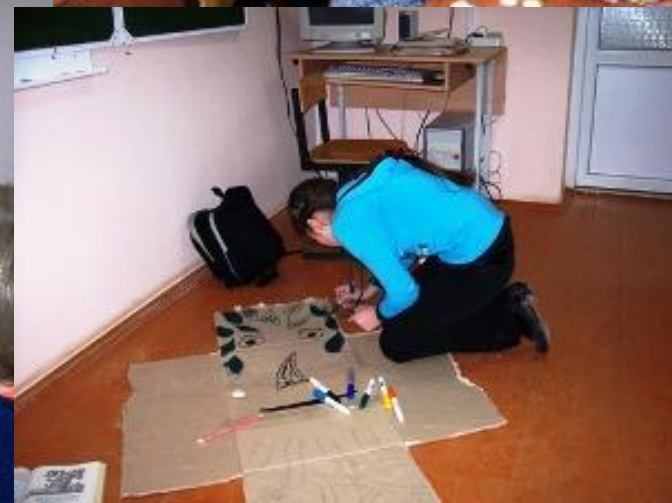
Подготовка к КВН