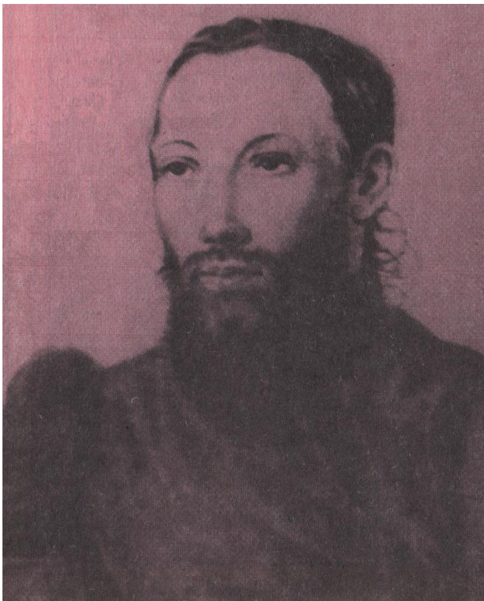
Н.Я Бичурин (1777-1853 гг.)