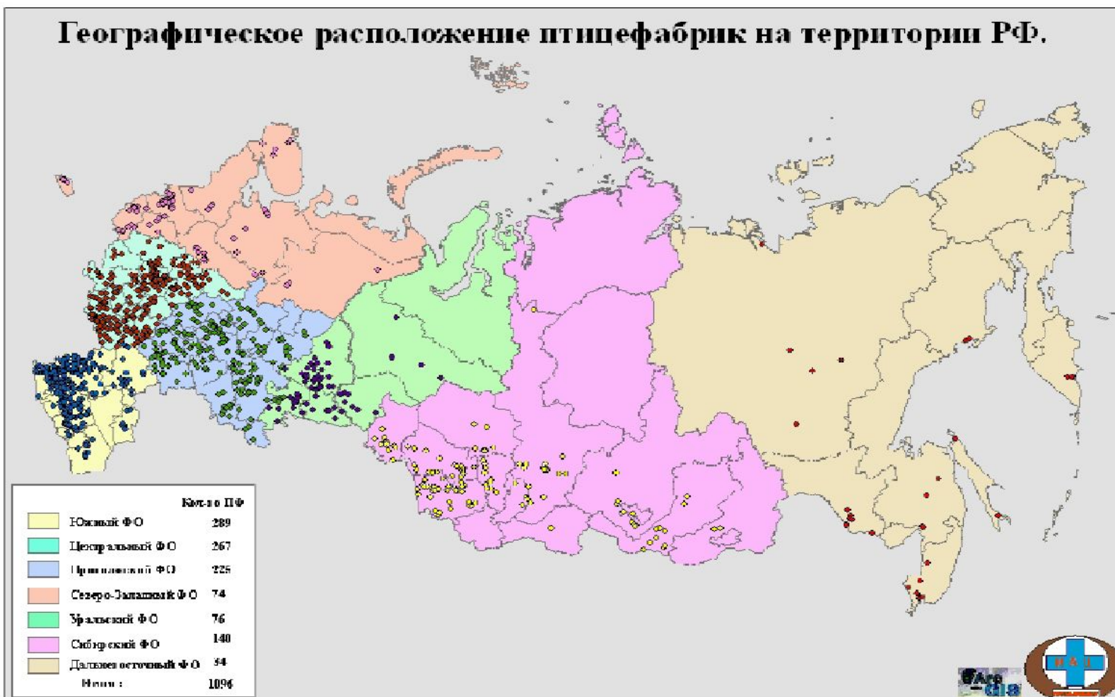
Географическое расположение птицефабрик на территории РФ.