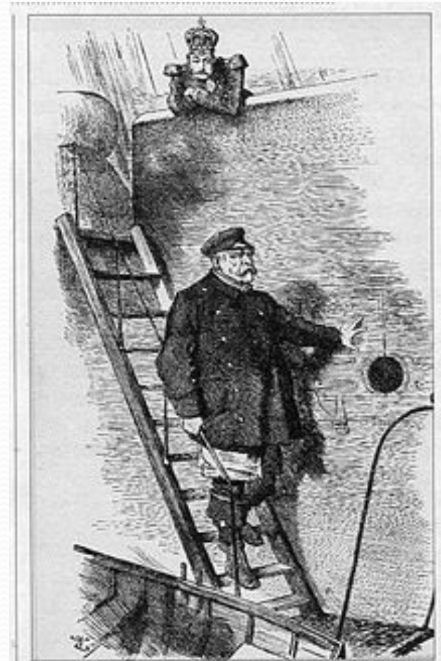
„Der Lotse verlässt das Schiff“: Mit dieser Karikatur kommentierte die britische Zeitschrift Punch 1890 die Entlassung des 75-jährigen Reichskanzlers.

13 марта 1871 года он подписал вместе с представителями России и других стран Лондонскую конвенцию, отменившую запрет России иметь военный флот в Чёрном море. В 1872 году Бисмарк с Горчаковым организовали в Берлине встречу трёх императоров — германского, австрийского и российского. Они пришли к соглашению совместно противостоять революционной опасности.