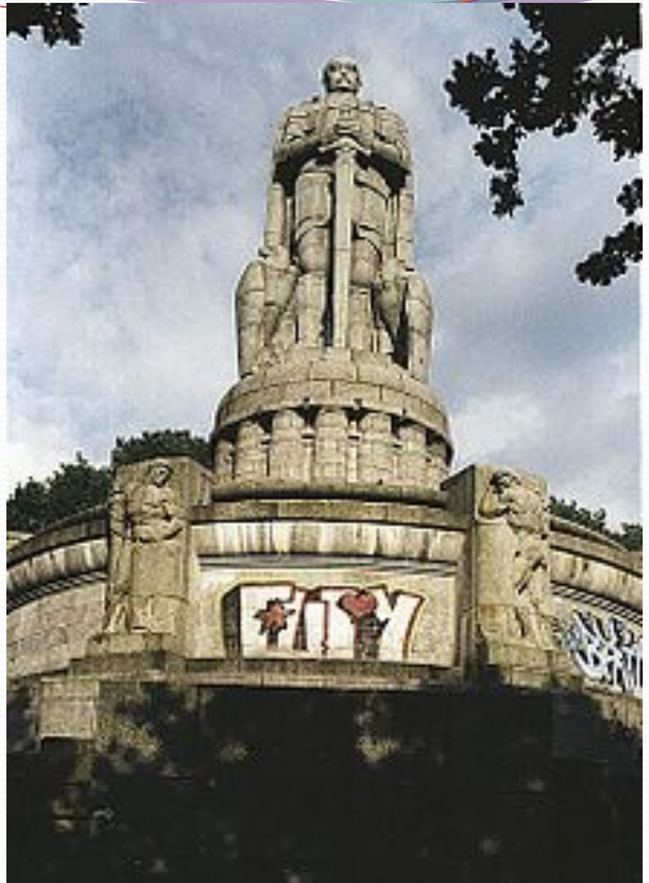
Памятник Бисмарку в Гамбурге.