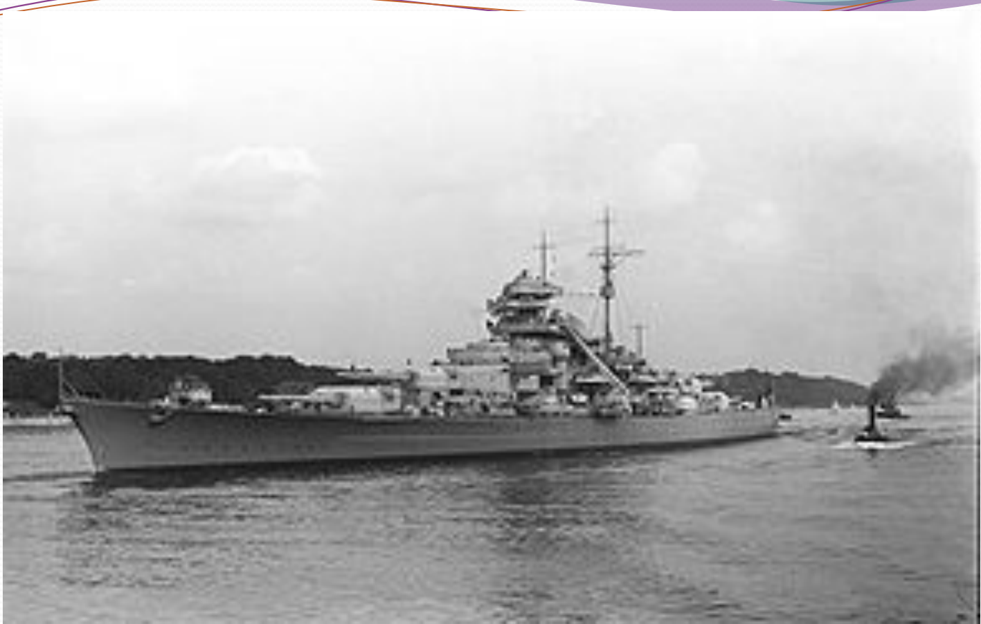
Линкор «Бисмарк», 1940 год