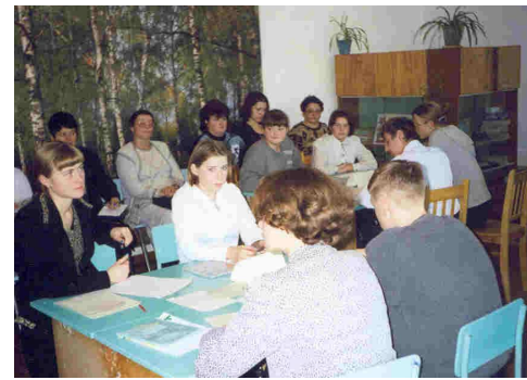
Кабинет истории, автоматизированное рабочее место учителя, проектор, экран