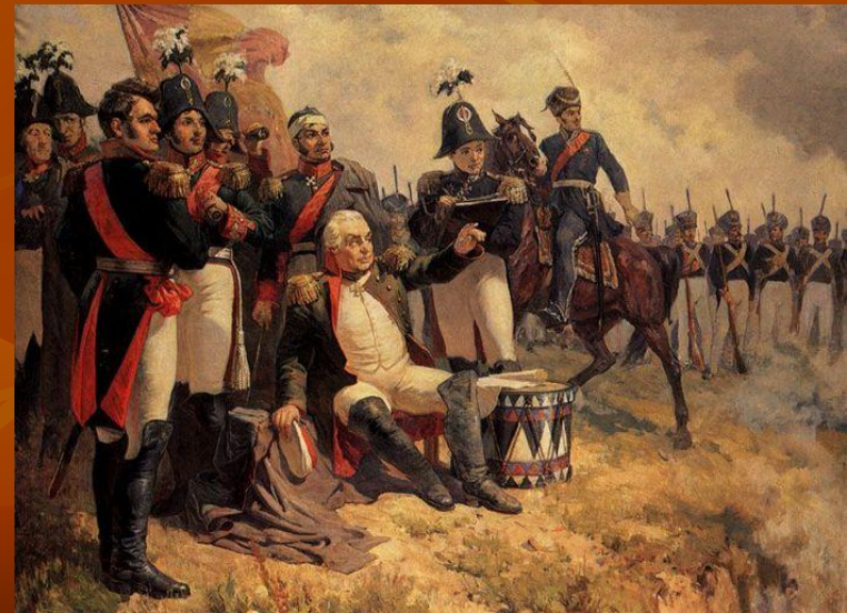
Кутузов в битве при Бородино

Скажи-ка, дядя, ведь не даром Москва, спаленная пожаром, Французу отдана? Ведь были ж схватки боевые, Да, говорят, еще какие! Недаром помнит вся Россия Про день Бородина!