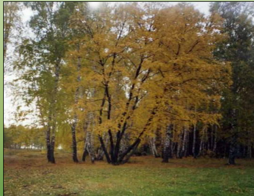
Черные березы дерево мутант Почему?