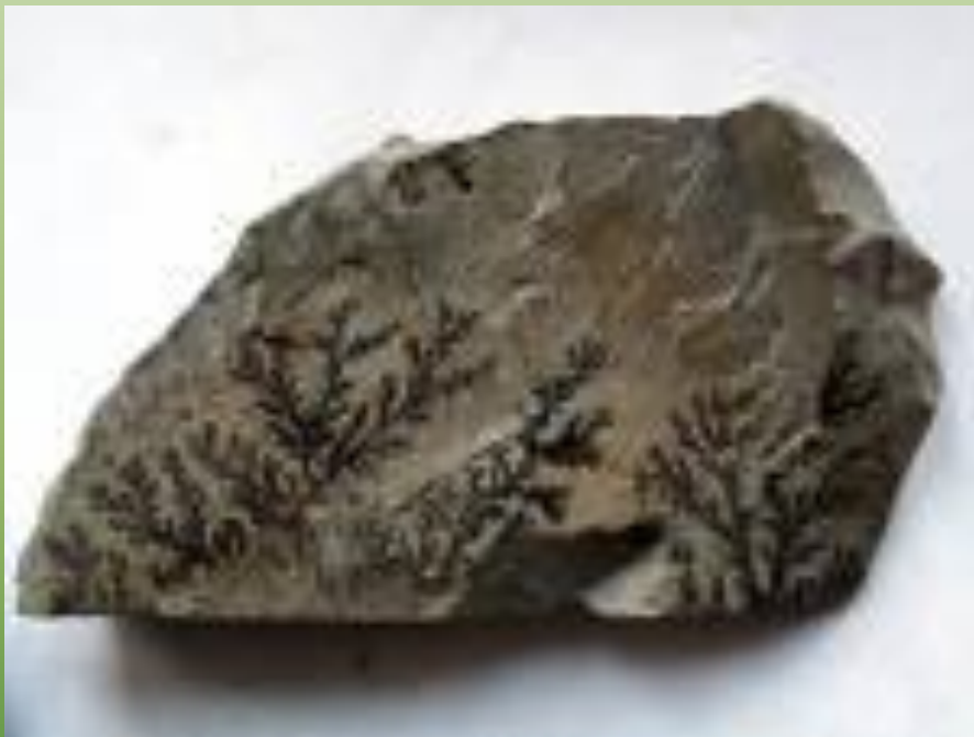
Дендриты Что это?