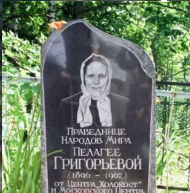
Памятник Праведнице Народов Мира Пелагее Григорьевой (Псковский район)