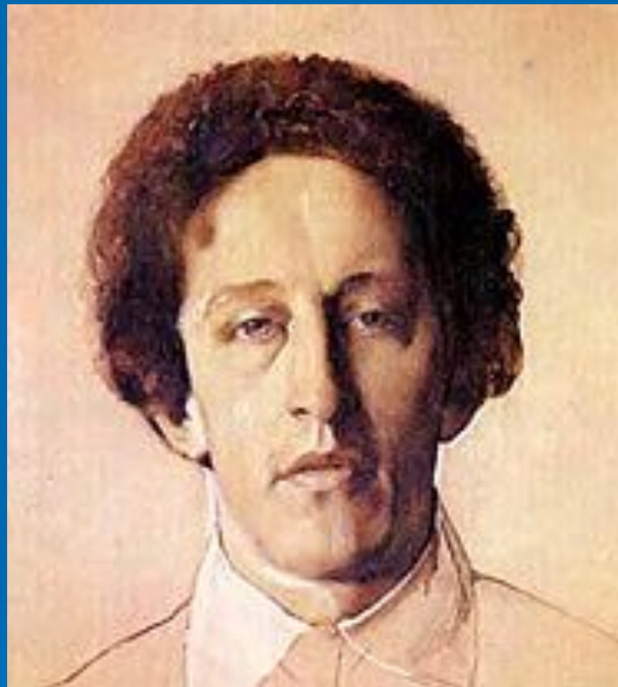
А. Блок (1880-1921)

□ Но чернеют пламенные дали — не уйти, не встать и не вздохнуть.