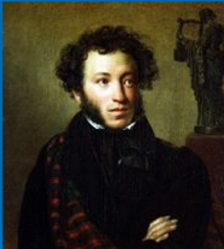
А. Пушкин (1799-1837)