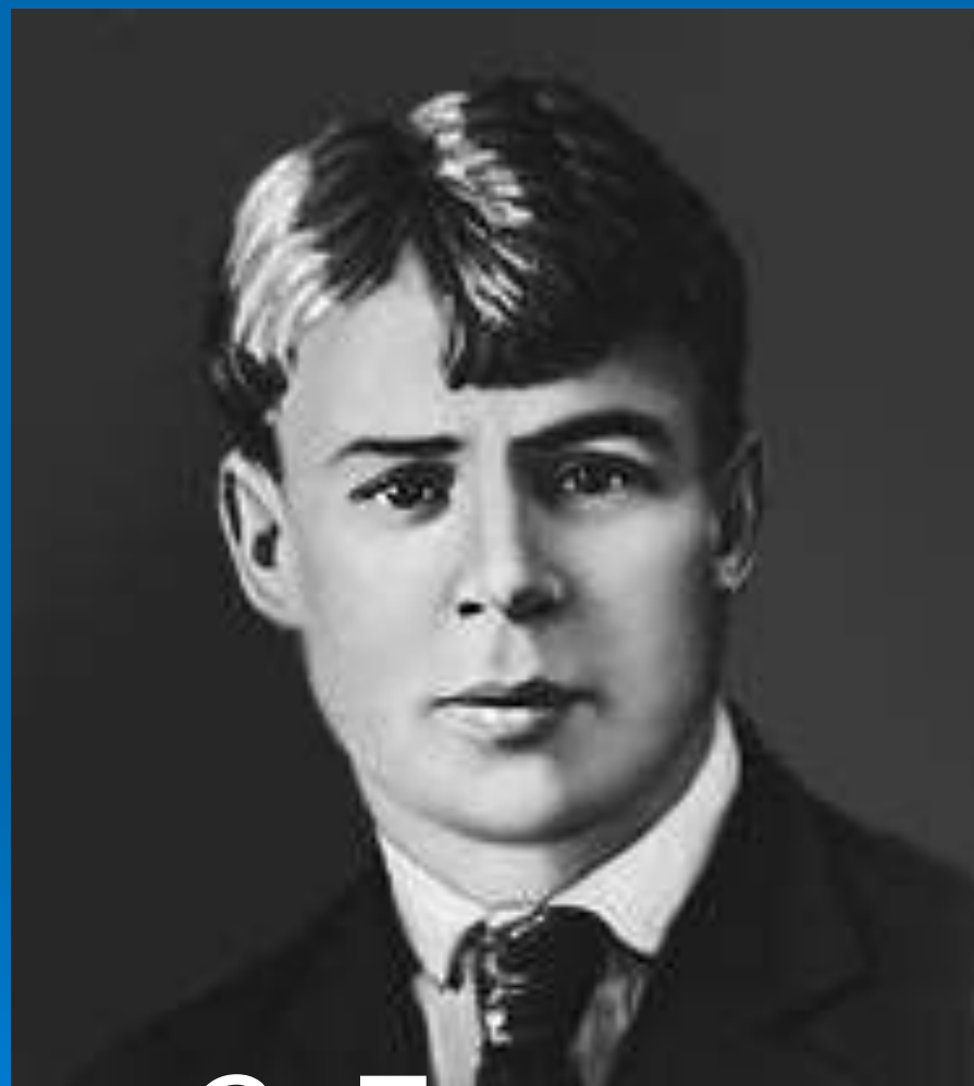
С. Есенин (1895-1925)