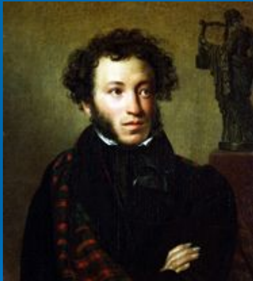
А. Пушкин (1799-1837)