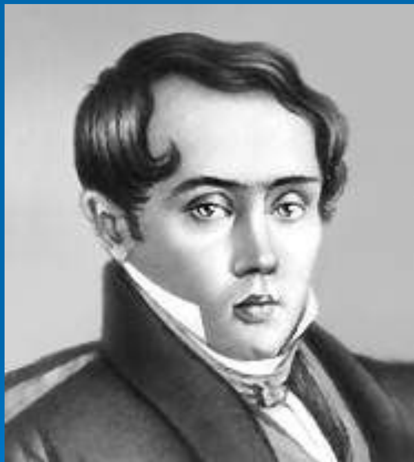
Е. Баратынский (1800-44)