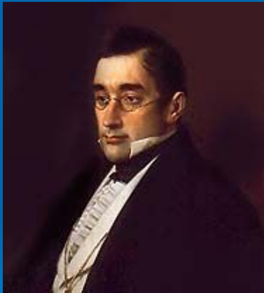
А. Грибоедов (1790 или 1795 -1829)