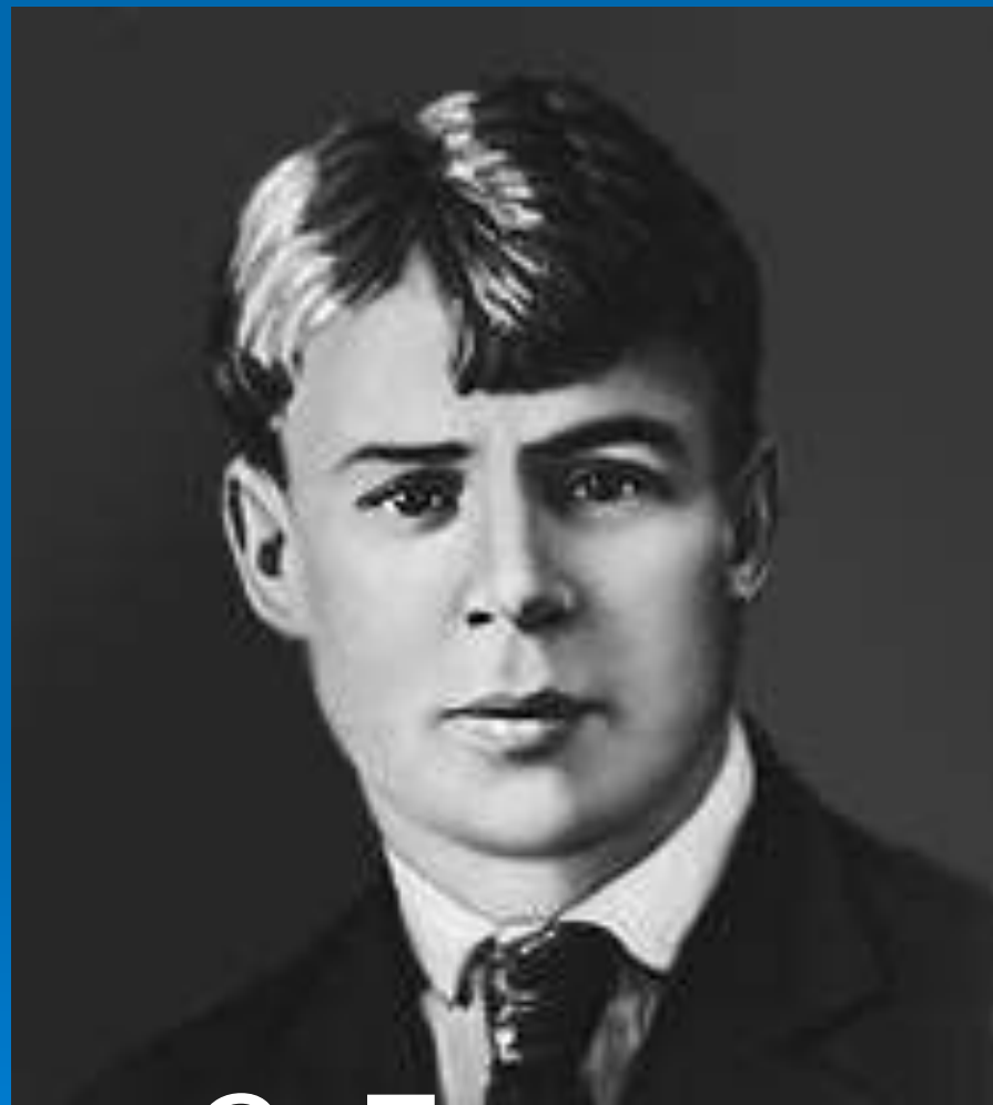
С. Есенин (1895-1925)