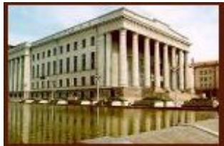
LIETUVOS NACIONALINĖ MARTYNO MAŽVYDO BIBLIOTEKA

Главной целью конференции была возможность объединить усилия по реализации проектов ISBD, FRBR, FRANAR, MARC наряду с пересмотром правил каталогизации.