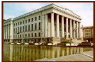
LIETUVOS NACIONALINĖ MARTYNO MAŽVYDO BIBLIOTEKA

Международное стандартное библиографическое описание принято во всем мире и используются в качестве правил каталогизации (именно такая практика существует в Литве), либо в качестве основы для многих национальных правил каталогизации.