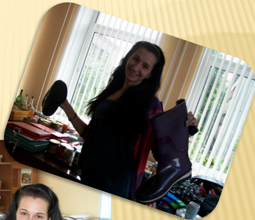
ЛАБОРАНТ КАБИНЕТА ТОВАРОВЕДЕНИЯ НЕ ПРОДОВОЛЬСТВЕННЫХ ТОВАРОВ