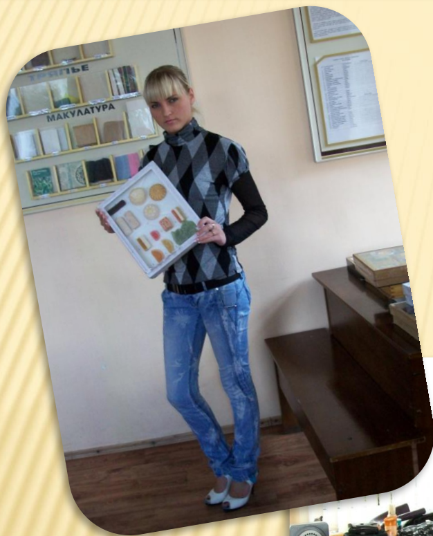
ЛАБОРАНТ КАБИНЕТА ТОВАРОВЕДЕНИЯ ПРОДОВОЛЬСТВЕННЫХ ТОВАРОВ