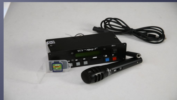
Транспортное громкоговорящее устройство (ТГУ)