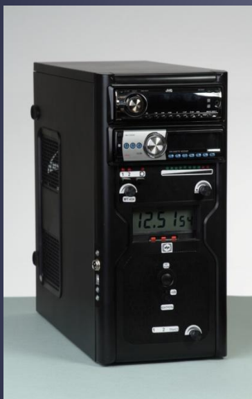
Установка поездного вещания (УПВ)