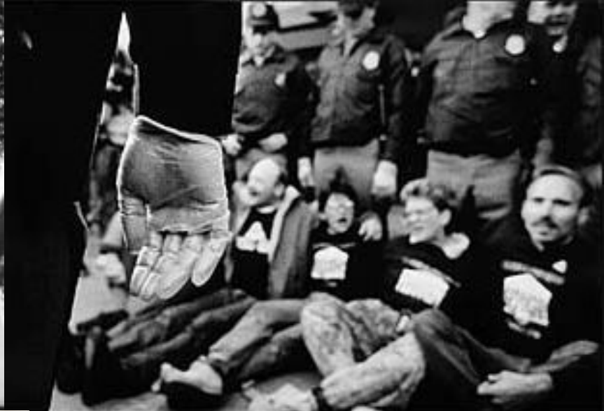
Protest demonstration, 1988. INTERNATIONAL AIDS CONFERENCE