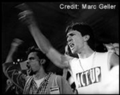
ACTUP protests at AIDS Conference, San Francisco