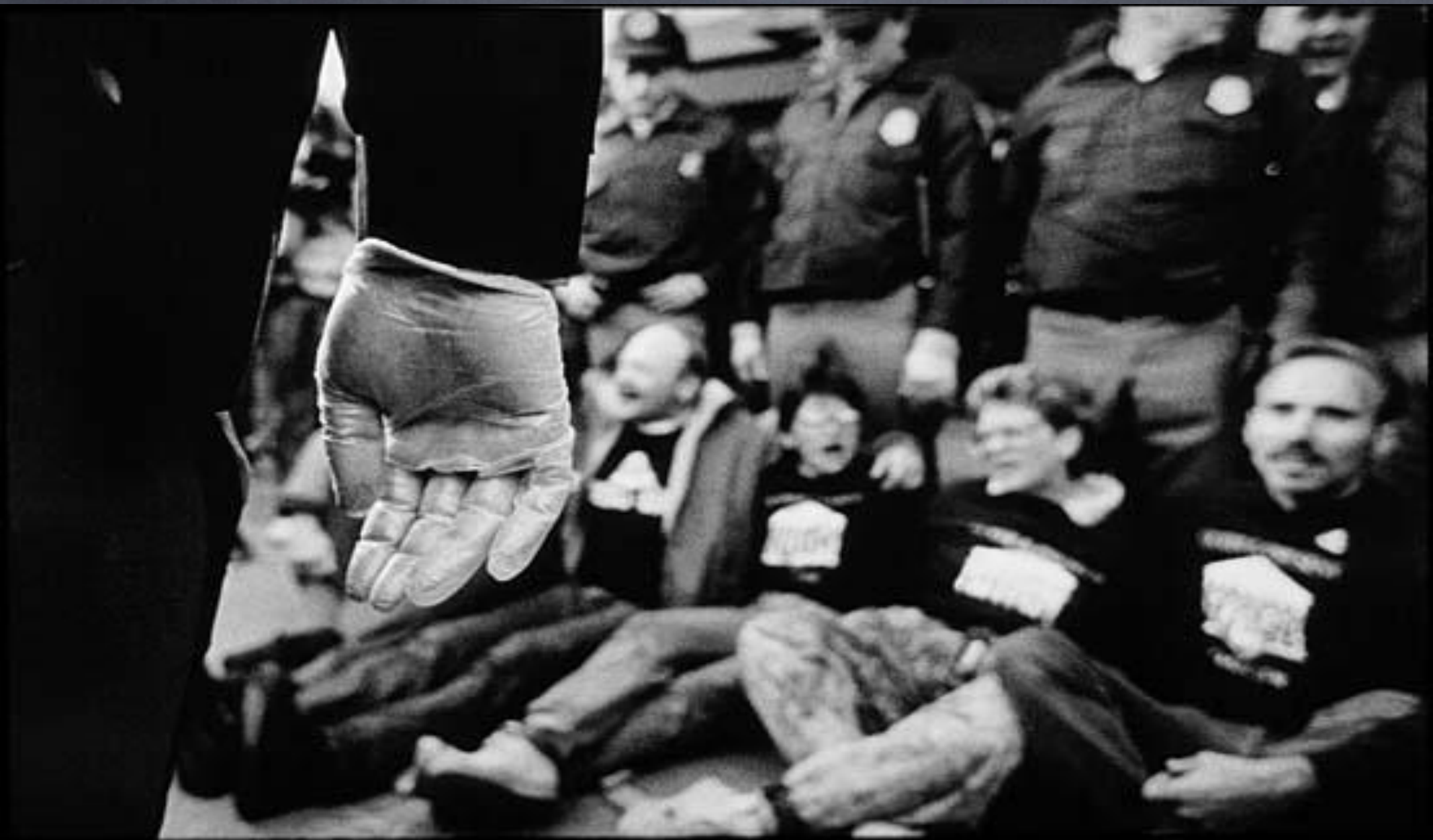
Act Up members block the entrance to the Food and Drug Administration building, October, 1988.