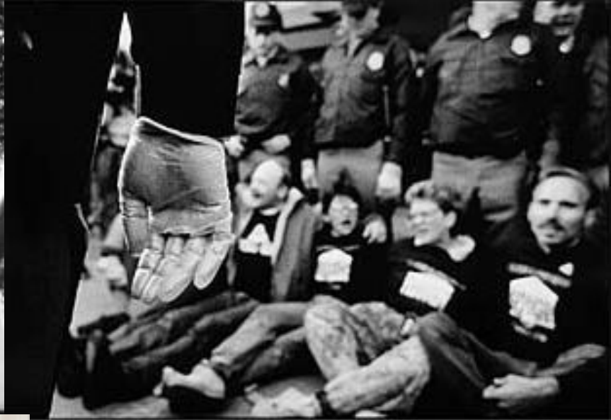
AIDS demonstration, 1988. INTERNATIONAL AIDS CONFERENCE