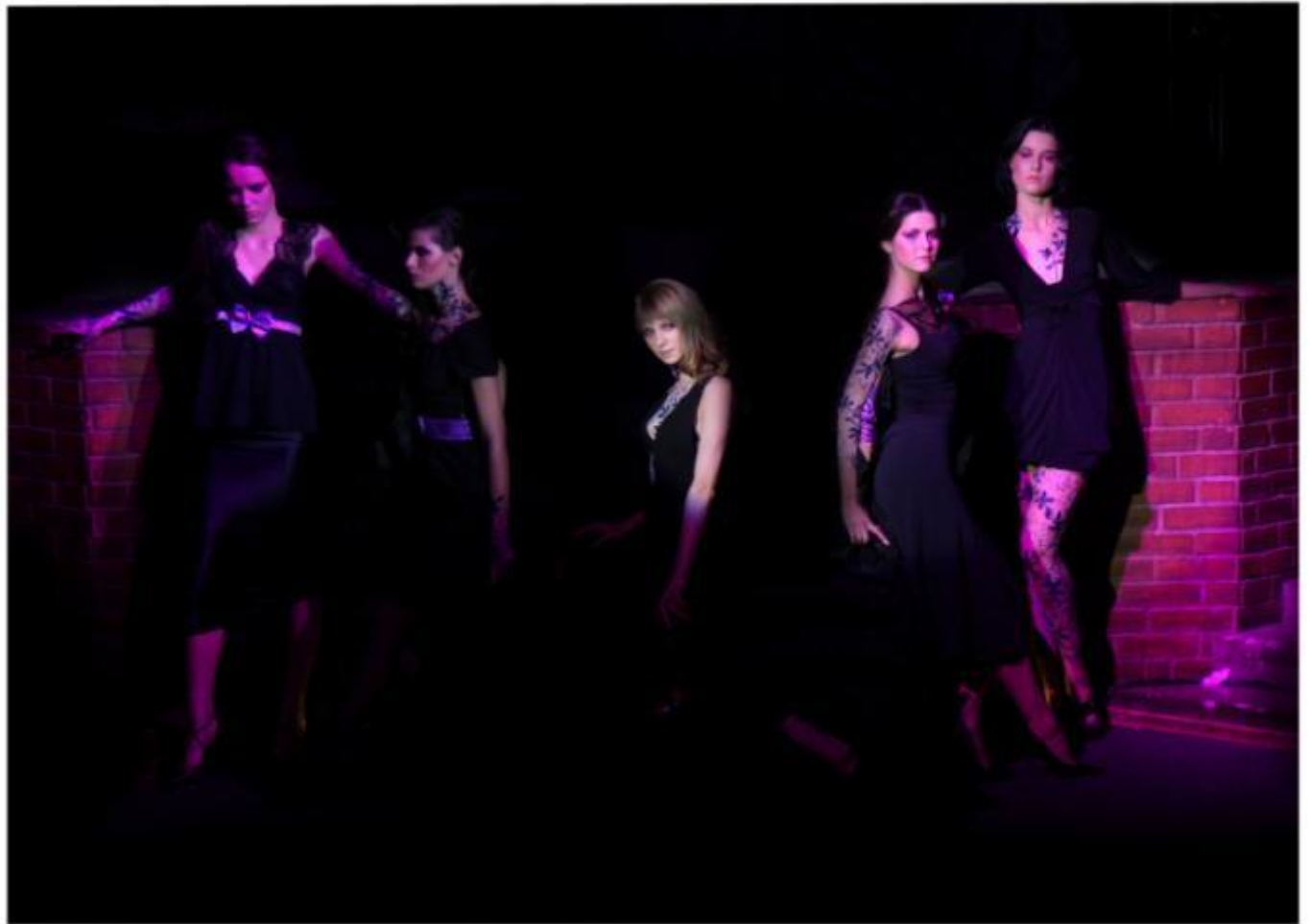
Рисунок на теле – ветвь каштана, аксессуары на одежде в фирменных цветах Vogue.

Имидж моделей создавался с использованием фирменных элементов Vogue.