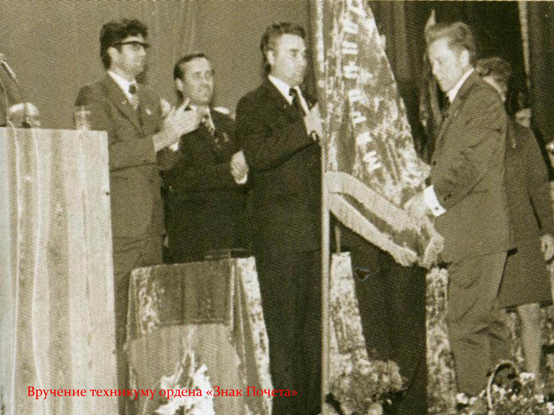
Вручение техникуму ордена «Знак Почета»