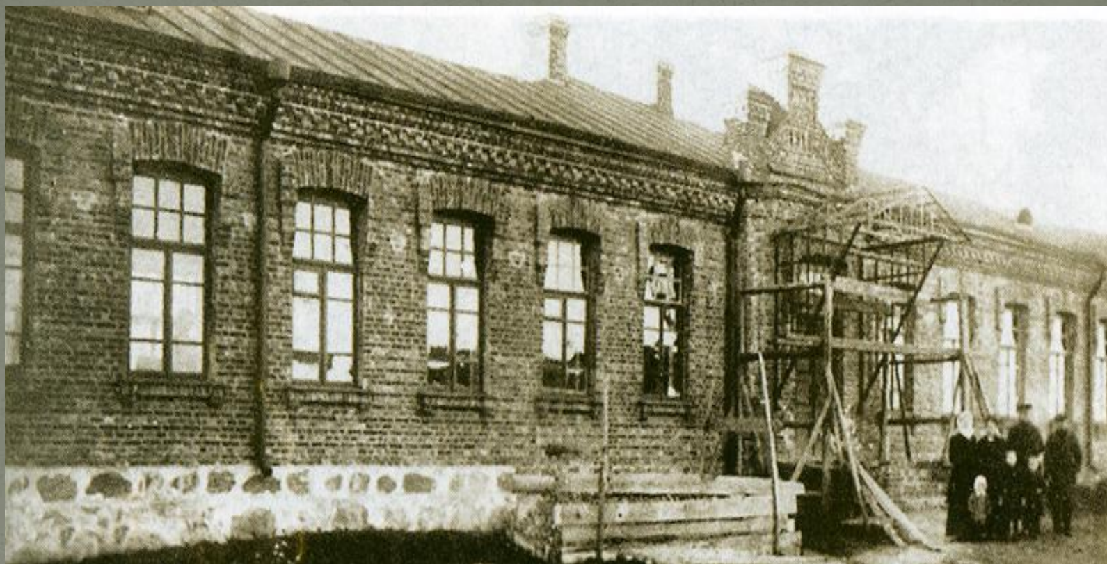
Ремесленные классы училища. Здание построено в 1911 году.