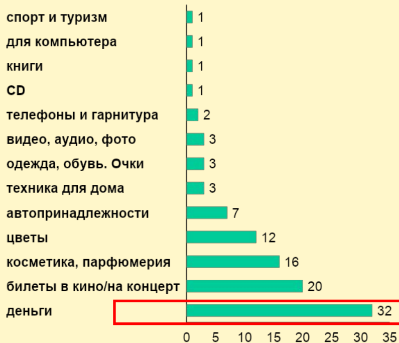
Что вы обычно дарите?