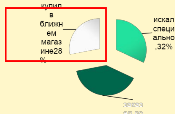
С какими трудностями вы сталкиваетесь, выбирая подарок?