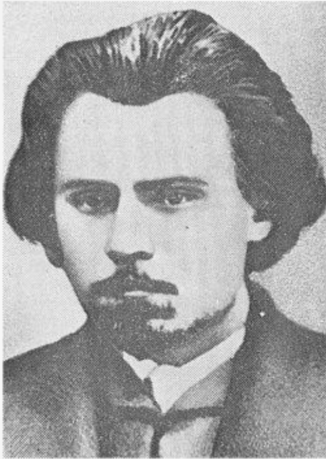
Андрей Иванович Желябов (1851-1881)