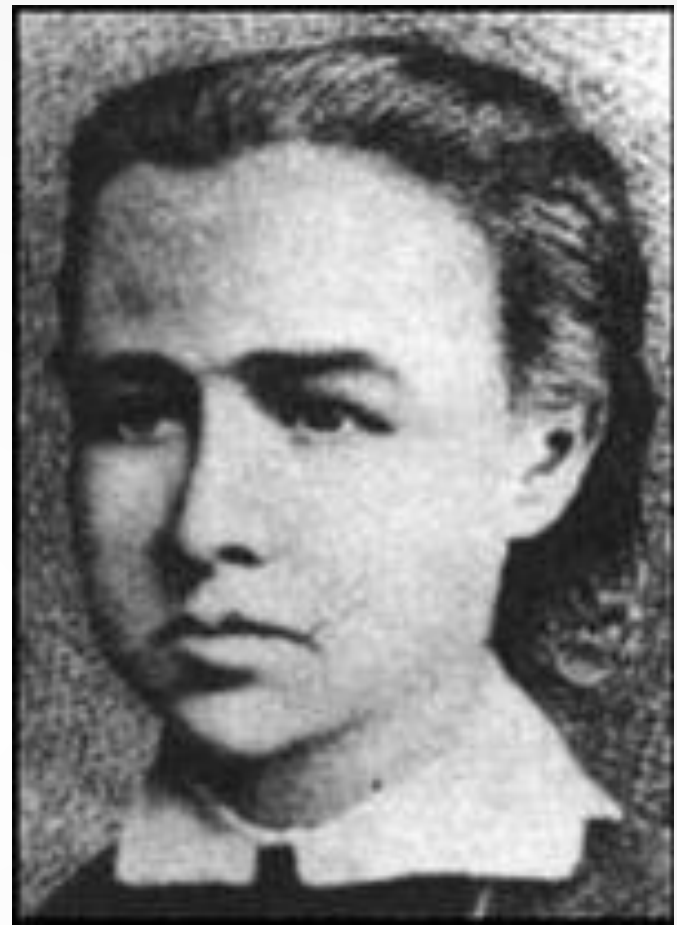
Софья Львовна Перовская (1853-1881)