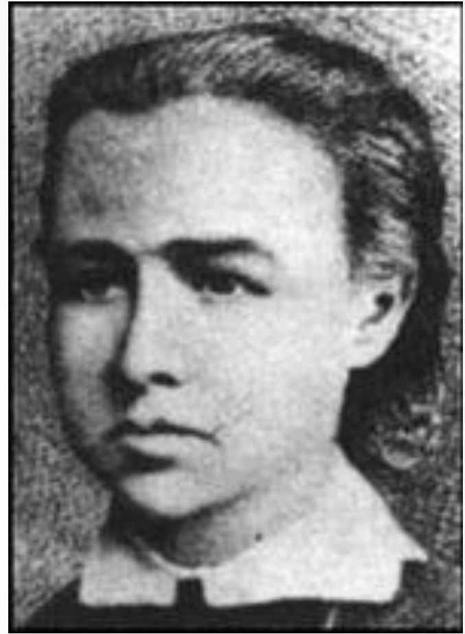
Софья Львовна Перовская (1853-1881)