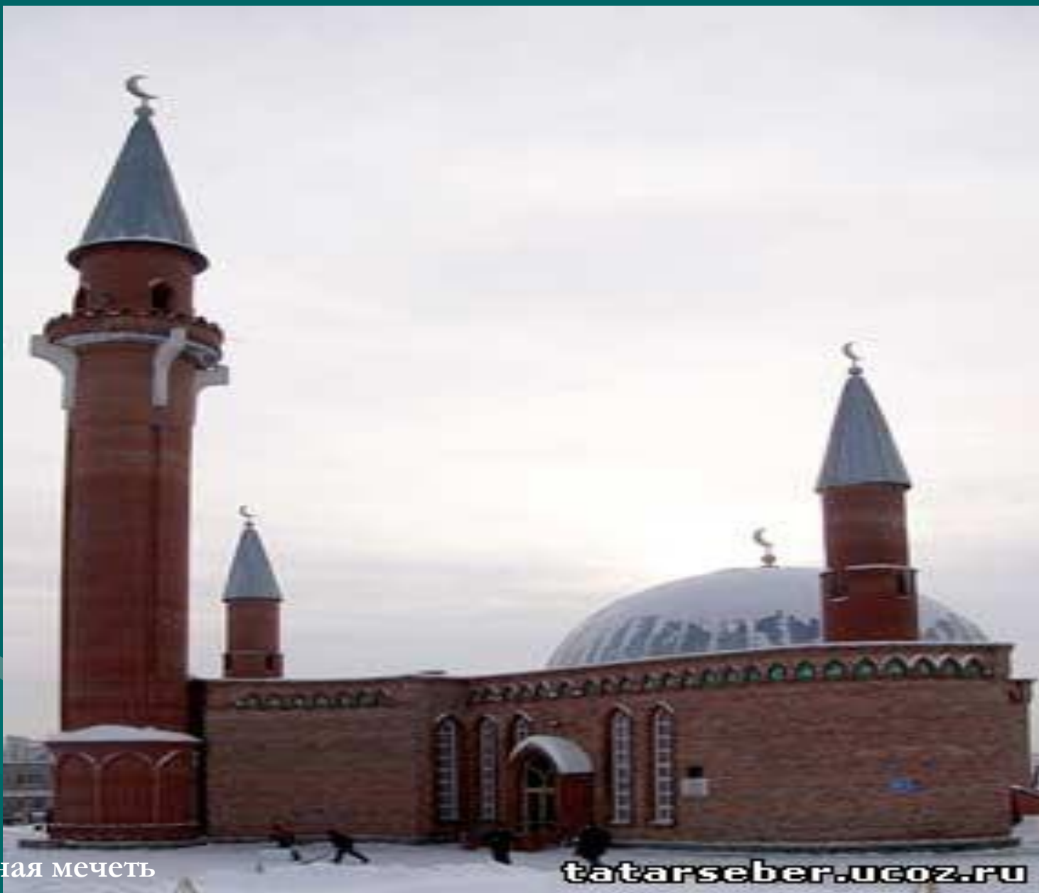
Соборная мечеть 08/15/2023