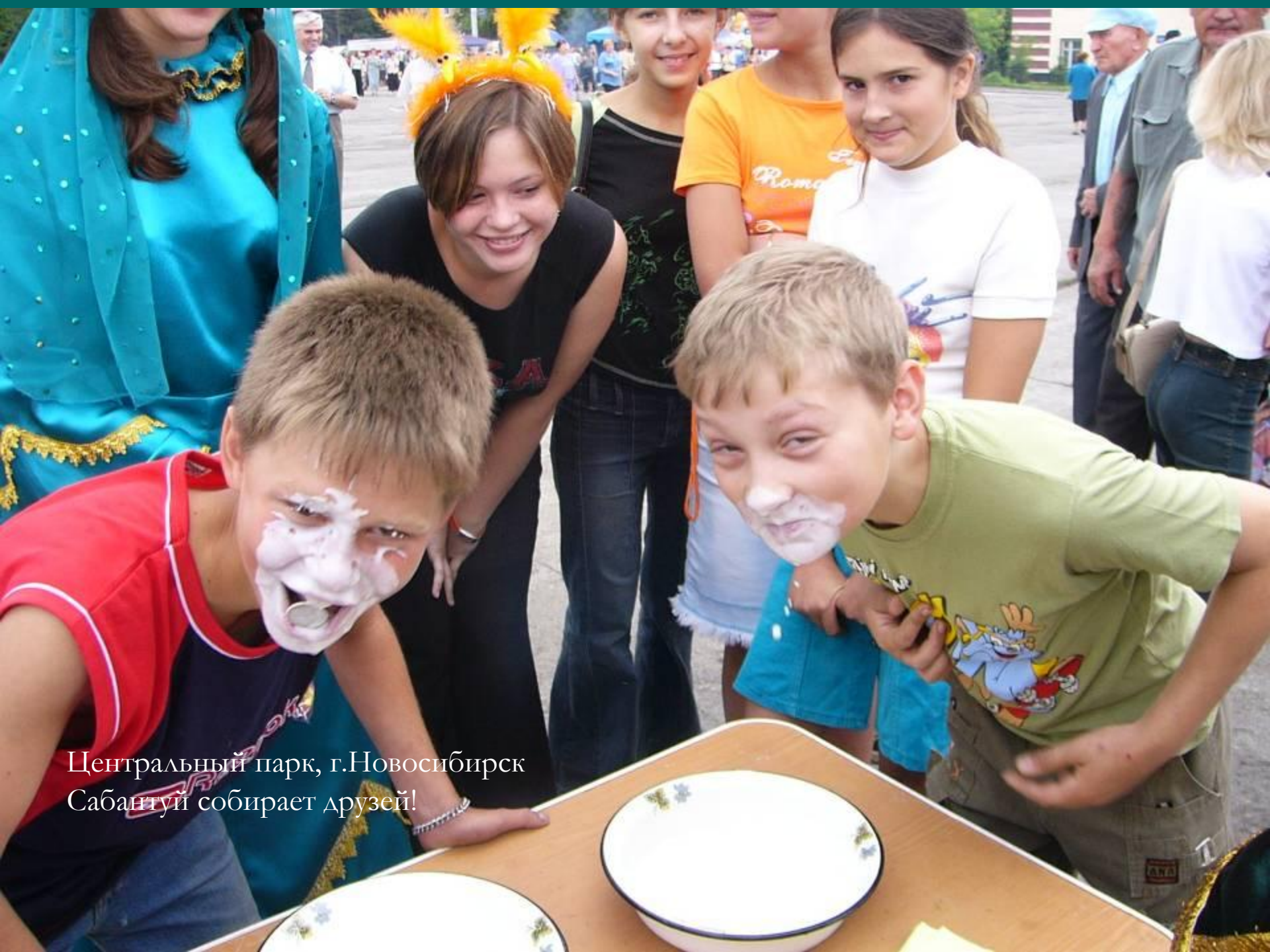
Центральный парк, г.Новосибирск Сабантуй собирает друзей!