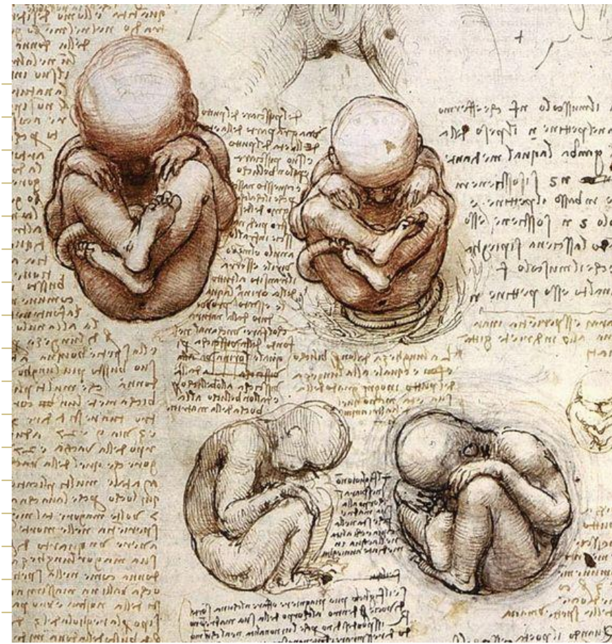
Views of a Foetus in the Womb (c. 1510 - 1512)