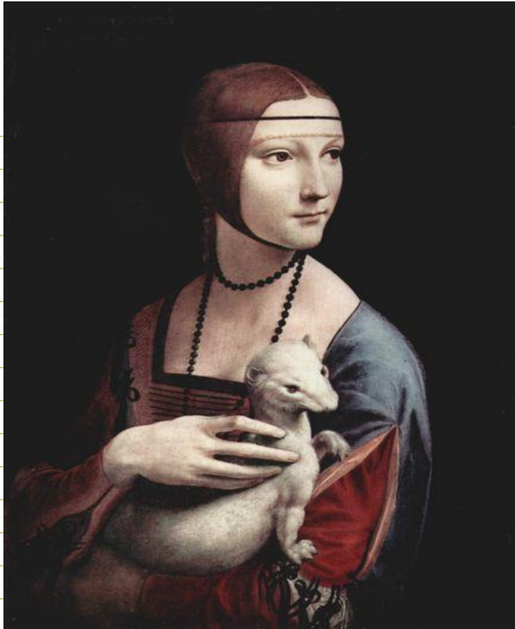
Portrait einer Dame mit Hermelin