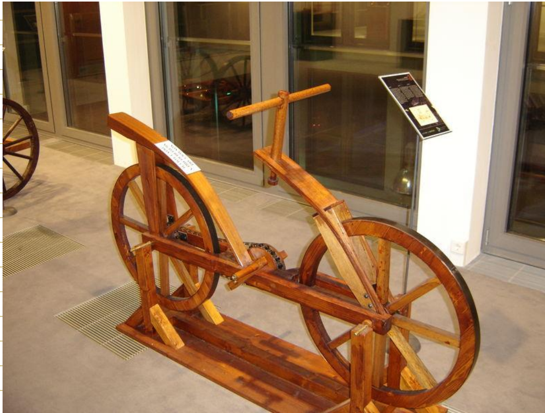
Leonardo da Vinci. Mensch - Erfinder - Genie exhibit