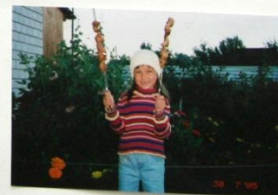
Я ХОЧУ ЧТОБЫ БЫСТРЕЕ НАСТУПИЛО ЛЕТО И МОЖНО БЫЛО БЫ ПРОВАТИТЬ НА ВОДУ С...