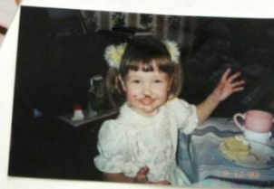
МОЁ ЛЮБИМОЕ БЛЮДО - ШОКОЛАДНЫЙ ТОРТ И „СМЕТАНИК“.