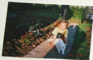
Я ОУЕНЬ ЛЮБАЮ ЭСВОНТ-НЫХ, ОСОБЕННО СВОЮ КОШКУ СИМУ.