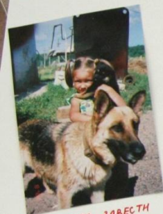
МОЯ МЕЧТА ЗАВЕСТИ СОБАКУ.