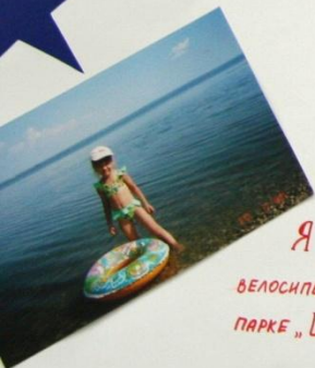
Я ЛЮБЛЮ КАТАТЬСЯ НА ВЕЛОСИПЕДЕ, КУПАТЬСЯ И ИГРАТЬ В ПАРКЕ „ШУРАЛЕ“.