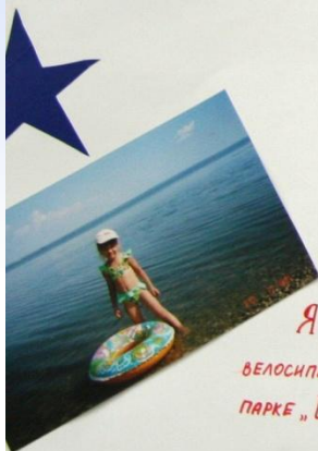
Я ЛЮБЛЮ КАТАТЬСЯ НА БЕЛОСИПЕДЕ, КУПАТЬСЯ И ИГРАТЬ В ПАРКЕ „ШУРАЛЕ“.