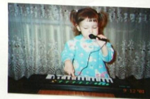
А ЕЩЁ МНЕ НРАВИТСЯ НАРАЖАТЬСЯ И ПЕТЬ.