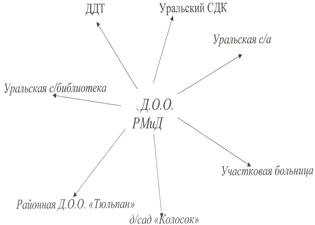
Схема сотрудничества Д.О.О. «РМиД» с другими организациями