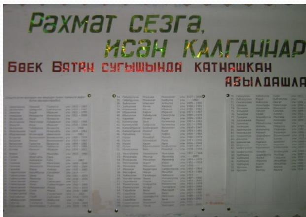
(Списки погибших и вернувшихся с победой из ВОВ односельчан.. Экспозиции из школьного музея)

Наша земля не испытывала взрыва вражеских бомб и снарядов в период ВОВ, нашу землю не топтали фашисты, но на фронтах сражались более 15 тысяч человек уроженцев Октябрьского района, более половина которых сложили головы на полях сражения.