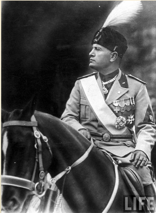
Бенито Муссолини Гитлер