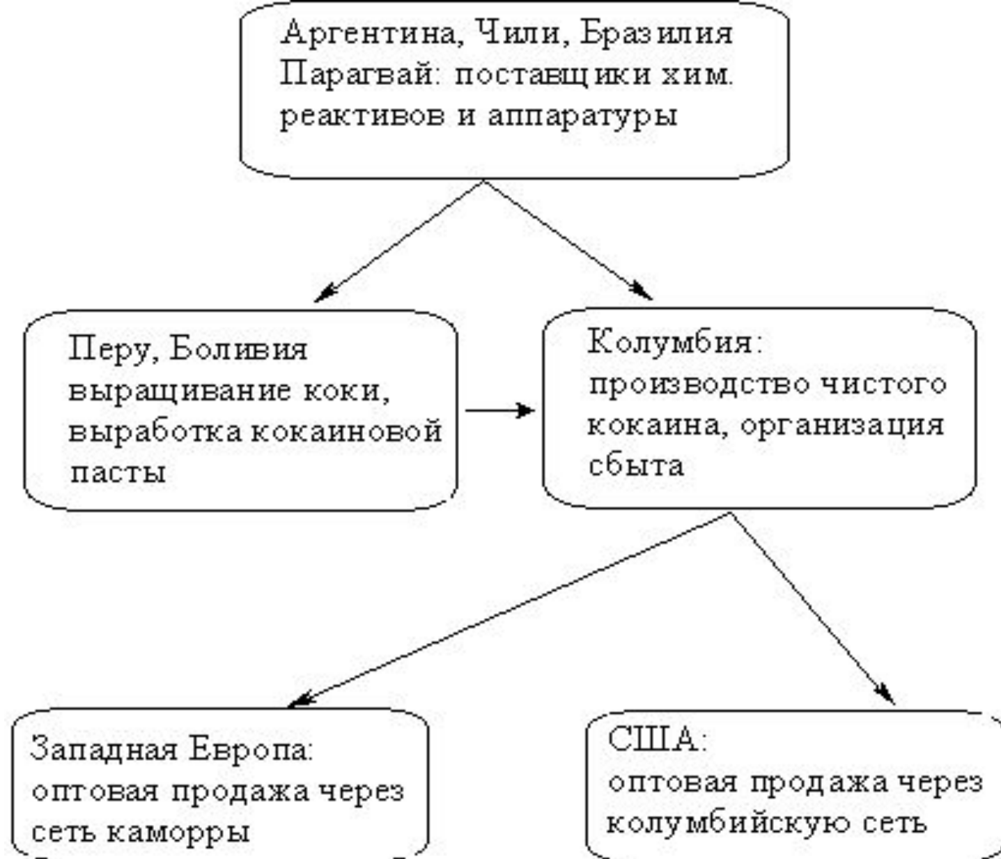
Рис. 3. Технологическая цепочка кокаинового бизнеса (1980-1990)