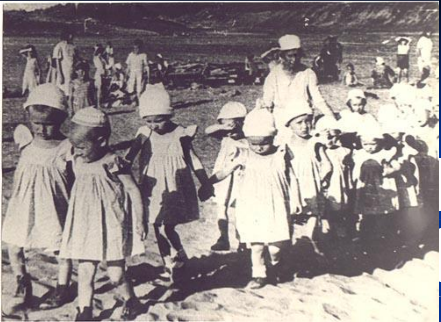
Дети, эвакуированные из блокадного Ленинграда