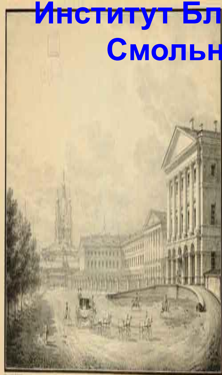
Воспитательное общество благородных девиц. Смоленский монастырь.