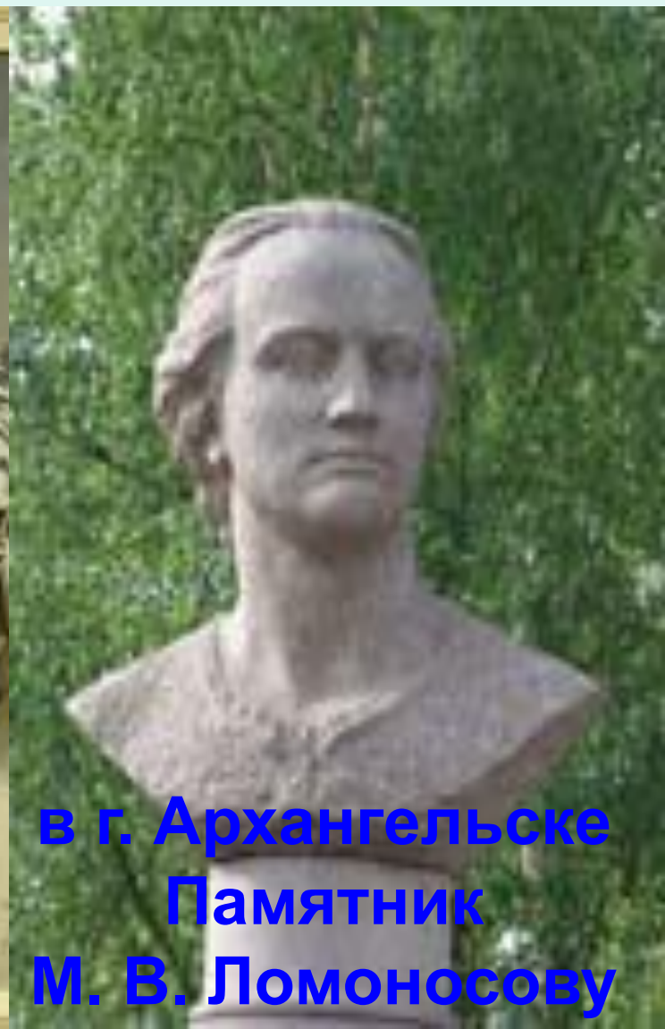
в г. Архангельске Памятник М. В. Ломоносову