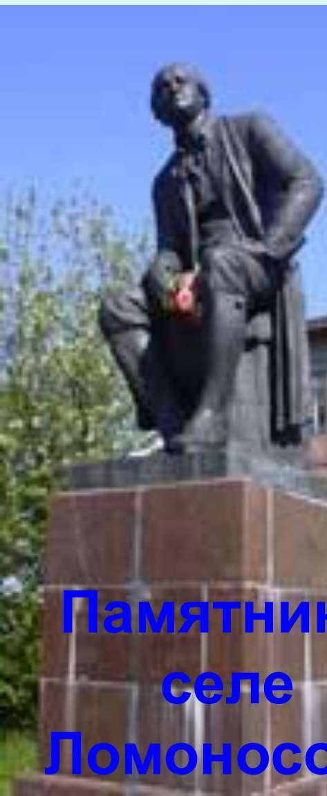
Памятник в селе Ломоносово