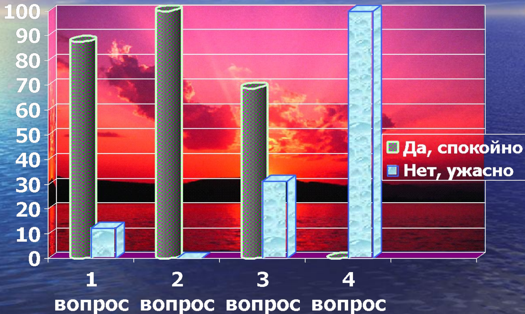
ДИАГРАММА. (ПО ОПРОСУ 8 «Д»)