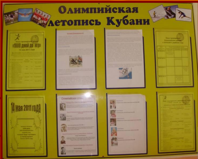
Оформление стенда в рекреации школы