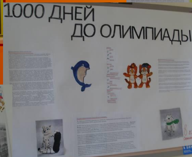
Оформление информационных стендов в классах