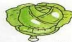
капуста — cabbage