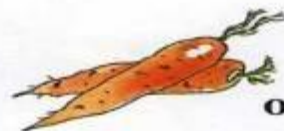
морковь — carrot