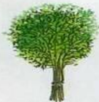
укроп — dill