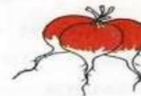
редиска — radish