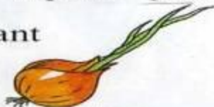
лук — onion