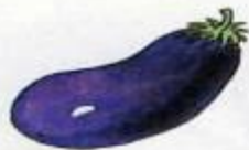
баклажан — egg-plant