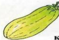
кабачок — marrow