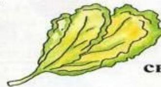
салат — lettuce