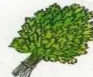
шпинат — spinach