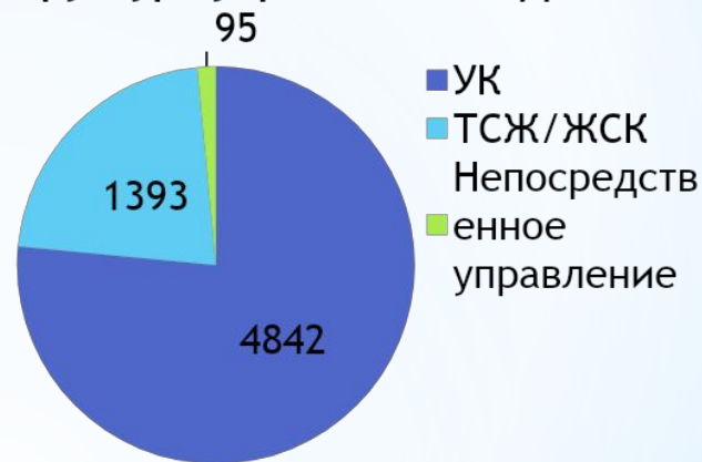
Размер платы за услуги