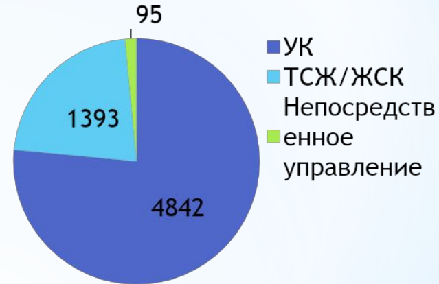
Размер платы за услуги