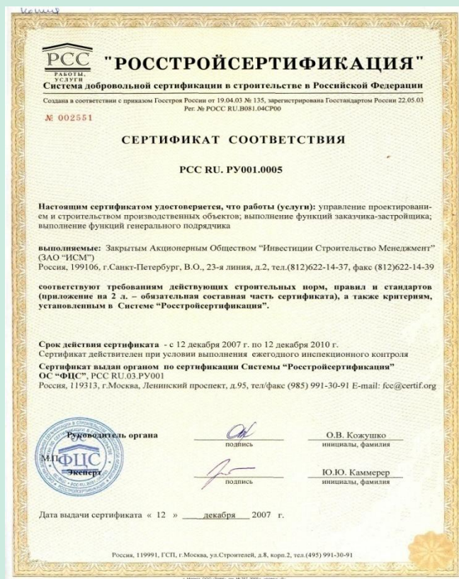
Сертификат соответствия PCC RU.PУ001.0005 «Росстройсертификация»