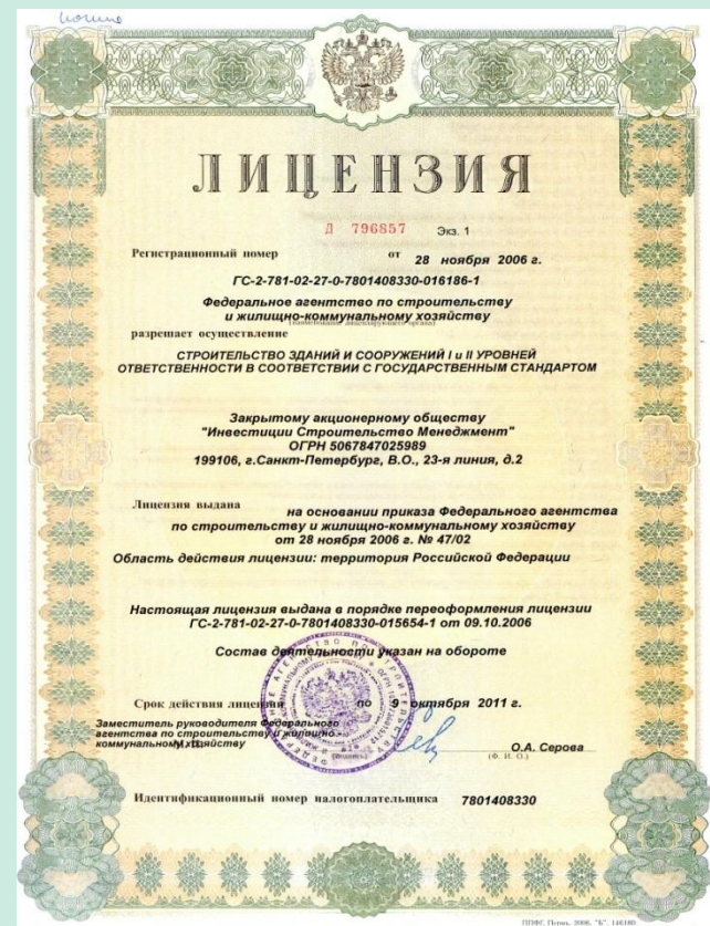
Лицензия ГС-2-781-02-27-0-7801408330-016186-1 строительство зданий и сооружений I и II уровней ответственности