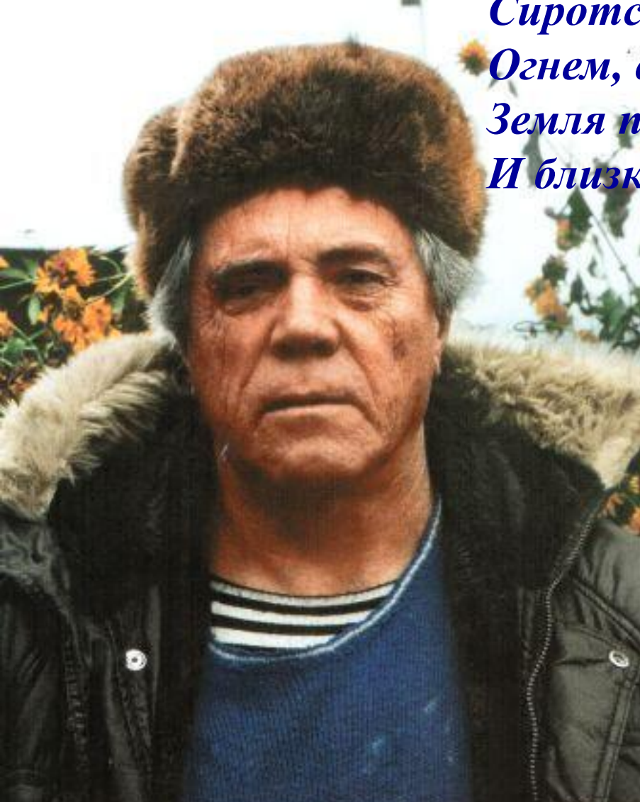
В.П.Астафьев на речке Омь. 1987.