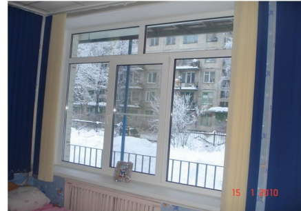
Справка по произведенным ремонтам согласно договорам благотворительного пожертвования со стороны родителей

3. Замена деревянных окон в спальном комнате группы № 6 на металлопластиковые. (производство демонтажа старых окон, подоконников и установка металлопластиковых конструкций, утепление, отделка откосов, установка отливов, вывоз мусора) Количество окон- 3 шт.