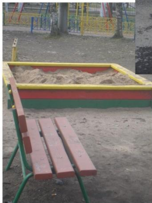
Справка по установленному уличному оборудованию за счет ассигнований Муниципального собрания Полюстрово