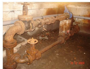
Произведенные ремонты в 2009 году за счет средств бюджета.

Демонтаж старого покрытия , выравнивание пола, установка кафельного покрытия, затирка швов. ООО "Смайл" 178 783,00р.