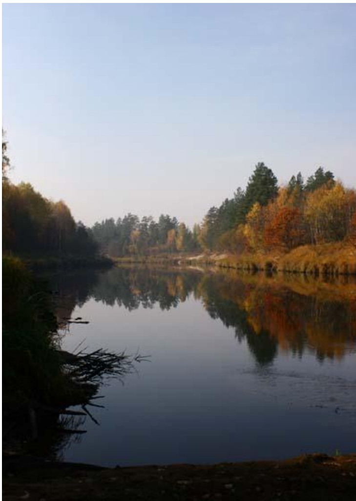
Рис. № 9 Керженец

Сейчас финно-угорское население Нижегородской области подвергается обрусению. Марийцы вытеснены за Ветлугу, поэтому «русско-народная» этимология уводит исследователей в такие формулы, как «Рустай» = «Русская тайга». Подобные поверхностные суждения недопустимы.