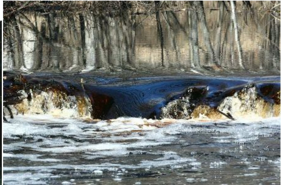
Рис. № 12