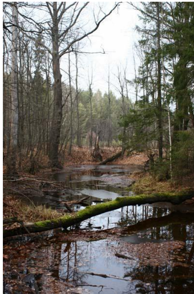
Рис. № 10 Макаришка