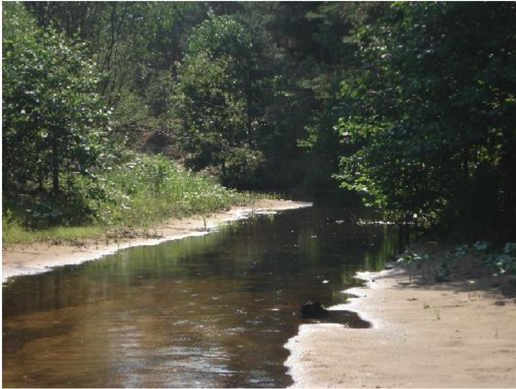
Рис. № 11

Мы лишь предложили возможные варианты и выдвинули ряд гипотез. В данный момент продолжаем уже многолетнюю работу, развивая свои предположения и работая над ошибками.