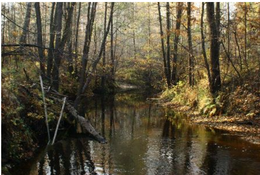
Рис. № 7

Пугай, Пугайчик. Мы склонны полагать, что звук [т] был заменен на [п] в поздний период. В марийском и татарском языках слово « тогай/тугай » означает «залив, пойма, излучина реки». Здесь мы видим пример тюркского влияния на марийский язык.