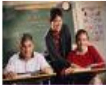
achieve and enjoy