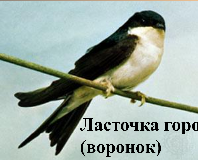
Ласточка городская (воронок)