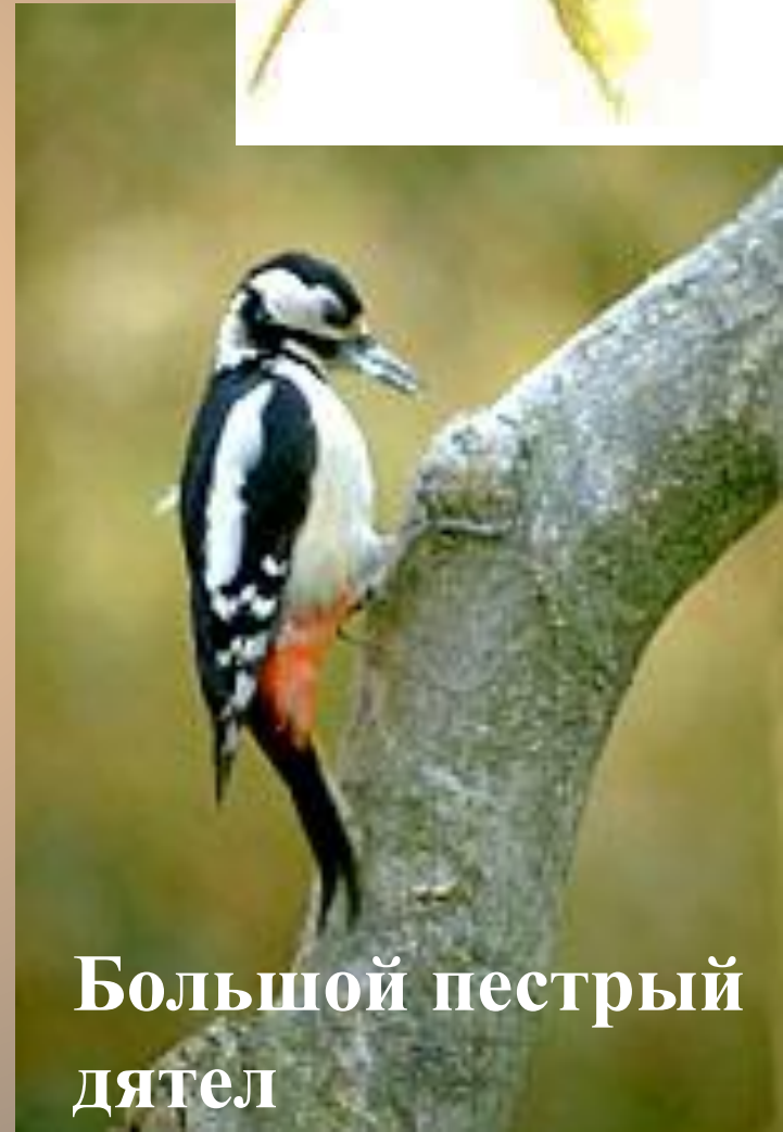
Большой пестрый дятел