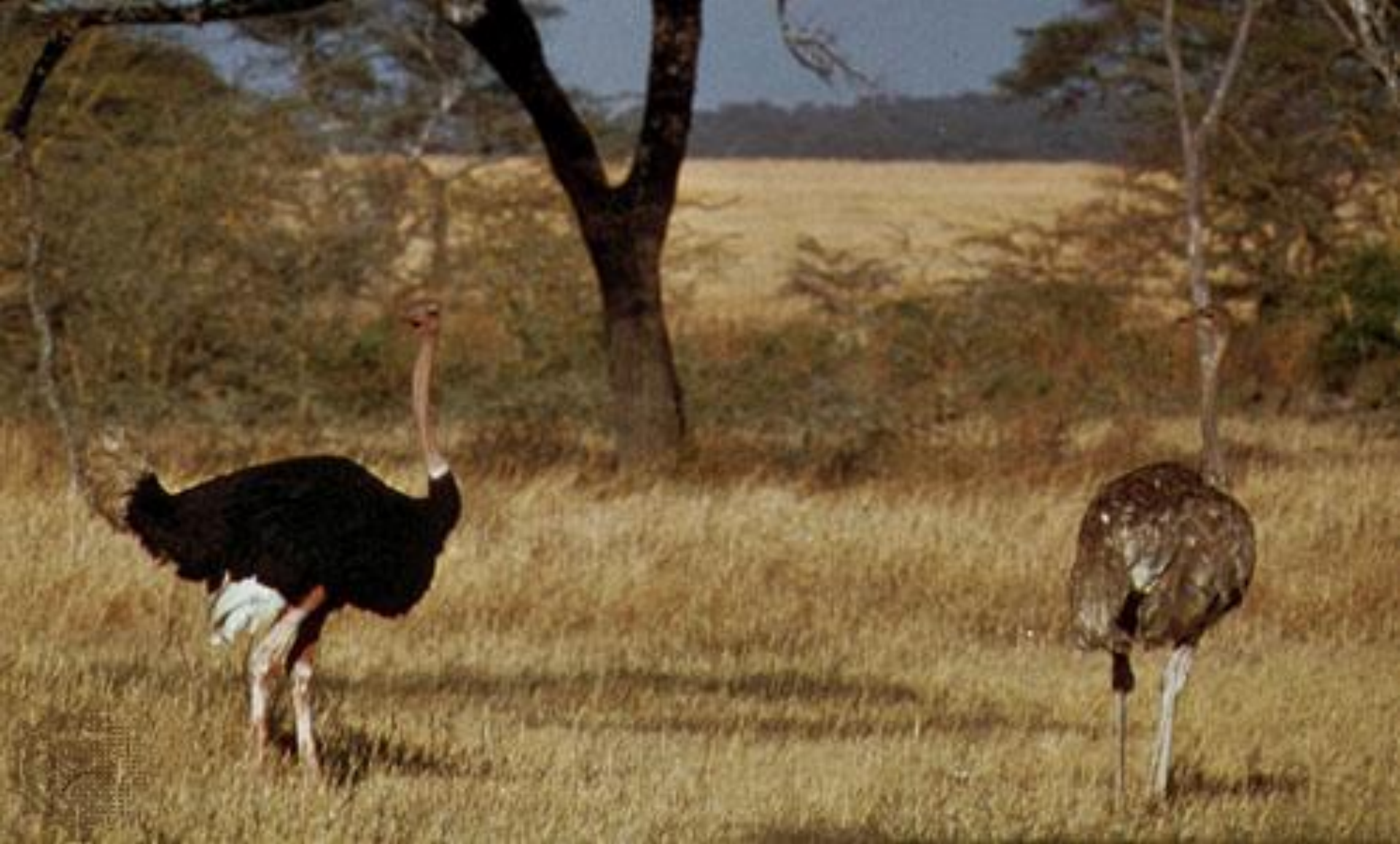
Африканский страус (самец и самка)