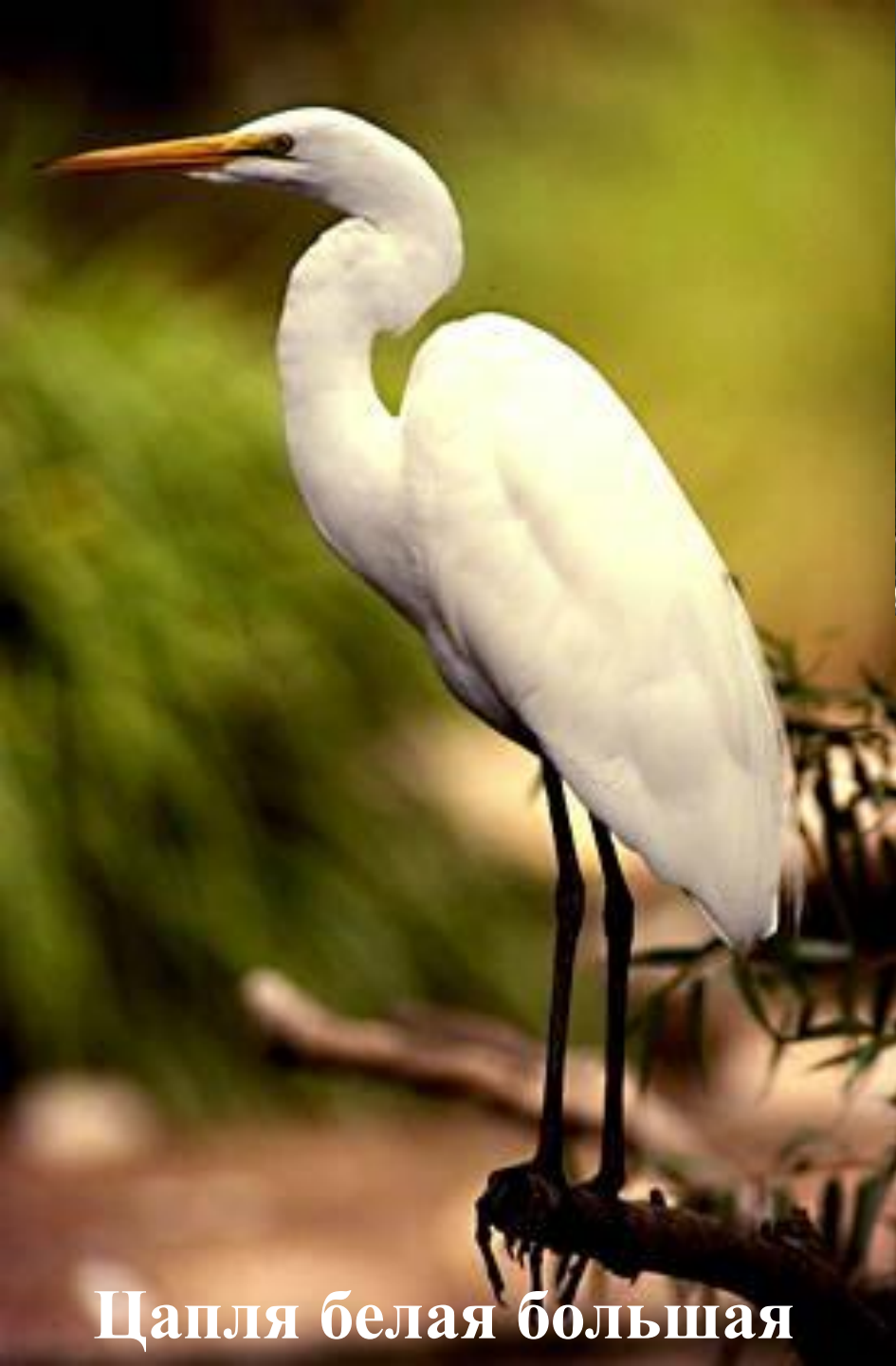
Цапля белая большая