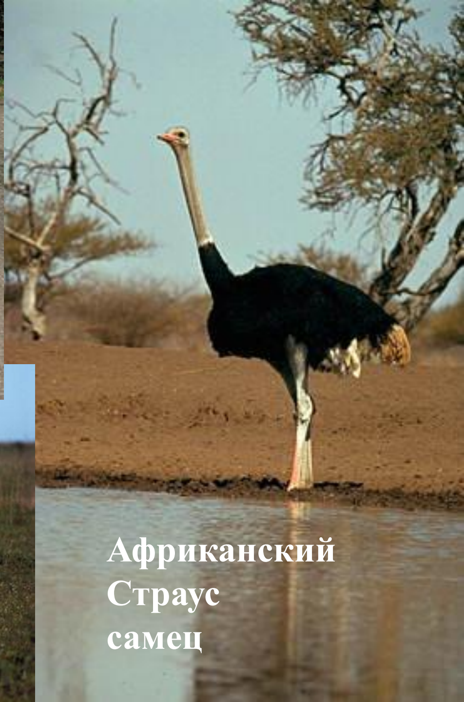
Африканский Страус самец